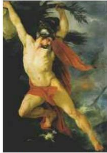
9. Αίας ο Λοκρός. Πίνακας του Ιταλού ζωγράφου Φραντσέσκο Σαμπατέλι, 1829. (Μουσείο Παλάτσο Πίπ, Φλωρεντία)

Κι εκείνο τότε τον παρέσυρε βαθιά, στα απέραντα πελάγη, όπου και χάθηκε στα κύματα, πνίγηκε στ' αλμυρό νερό.