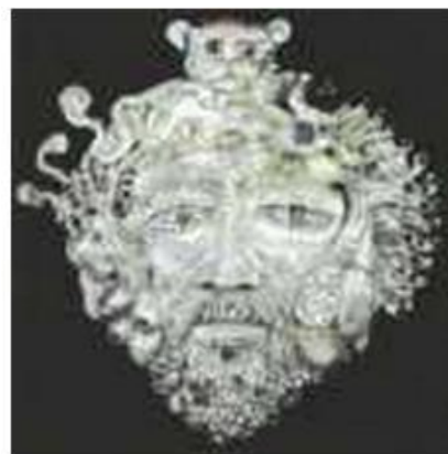
9. Μάσκα Πρωτέας. Ανάγλυφο -ασήμι και πολύτιμοι λίθοι- του Ν. Χατζηκυριάκου-Γκίκα.

«[...] Είκοσι μέρες οι θεοί μ' είχανε εκεί κλεισμένον, μήτε έπαιρνε απ' τη θάλασσα αγέρας να φυσήξει, που τα καράβια στου γιαλού ξεπροβοδάει τα πλάτια. Θα μας σωνόντανε οι θροφές και των αντρών το θάρρος, αν μια θεά δε μ' έσωνε, πονώντας, η Ειδοθέα, του γέρου του θαλασσινού η κόρη του Πρωτέα, που την καρδιά της τάραξα στα τρυφερά της στήθια. Με βρήκε που παράδερνα αλάργα απ' τους συντρόφους [...]. Σιμά μου στάθηκε η θεά και μου 'πε δυο της λόγια: "Τόσο πολύ είσαι αστόχαστος κι άμυαλος, ξένε, τόσο, ή θέλοντας αναμελάς και χαίρεσαι στα πάθια, έτσι όπως χάνεσαι καιρό μες στο νησί κλεισμένος κι ούτε άκρη δεν μπορείς να βρεις κι οι ναύτες σου δειλιάζουν;" Είπε και της απάντησα κι εγώ με δυο μου λόγια: "Θα σου τα πω μετά χαράς, όποια θεά κι αν είσαι, πως δεν το θέλει η γνώμη μου να χάνω τον καιρό μου, μα στους θεούς αμάρτησα που κατοικούν στα ουράνια. Μόν' έλα τώρα να μου πεις -όλα οι θεοί τα ξέρουν- ποιος έτσι μ' έδεσε θεός και μου 'κλεισε το δρόμο, και πώς θα φύγω στο γιάλό τον ψαροθρόφο απάνω;" Είπα, κι η λατρευτή θεά μ' απάντησε έτσι πάλε: "Μετά χαράς σου, ξένε, αυτά θα σου τα πω όπως είναι. Εδώ συχνάζει ένας θεός και του πελάγου γέρος, άψευτος απ' την Αίγυπτο προφήτης, ο Πρωτέας, που ξέρει όλης της θάλασσας τα βάθη κι είναι δούλος του Ποσειδώνα. Λένε αυτός πατέρας μου πως είναι. Αν συ, καρτέρι σταίνοντας, μπορέσεις να τον πιάσεις, αυτός το δρόμο θα σου πει, του ταξιδιού το μάκρος και στην πατρίδα πώς θα πας μες στ' αφρισμένο κύμα. [...]" » (Μετάφραση Ζήσιμου Σίδηρη)