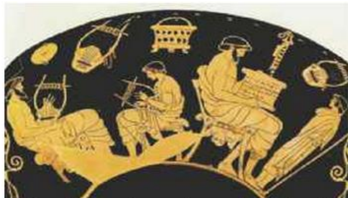
6. Διδασκαλία μουσικής και ποίησης – από κύλικα* του 5ου αι. π.Χ. (Βερολίνο, Αρχαιολογικό Μουσείο – διασκευή)

Στην 6 η εικόνα απεικονίζεται το τμήμα ενός αρχαίου αγγείου, στην επιφάνεια του οποίου αποτυπώνονται σκηνές από τη διδασκαλία των δύο κυριότερων μαθημάτων εκείνης της εποχής. Στην αριστερή πλευρά, παρακολουθούμε τη διδασκαλία του μαθήματος της μουσικής: ο δάσκαλος και ο μαθητής κάθονται ο ένας απέναντι