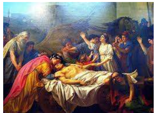
Εικόνα 2 " Ο θρήνος των γυναικών για τον Έκτορα"