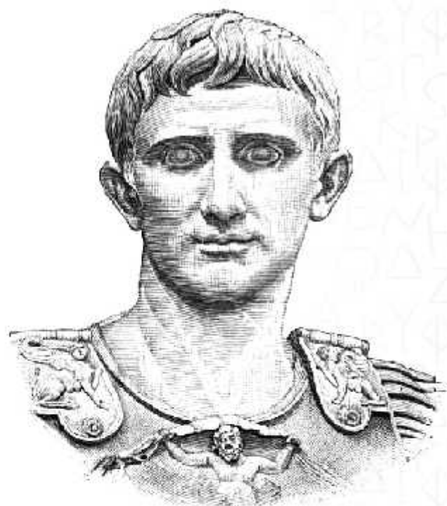
OCTAVIANUS AUGUSTUS 63 π.Χ.-14 Μ.Χ.