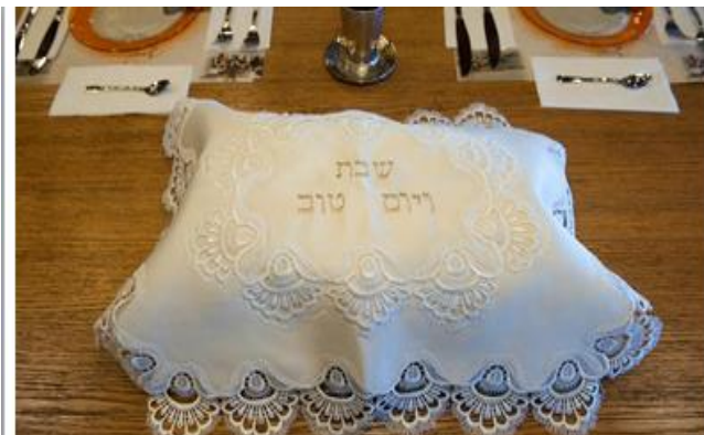
«Σαμπάτ Σαλόμ» - Ημέρα στοχασμού κι ανάπαυσης

Φωτογραφικό υλικό από τη σύγχρονη εβραϊκή ζωή: