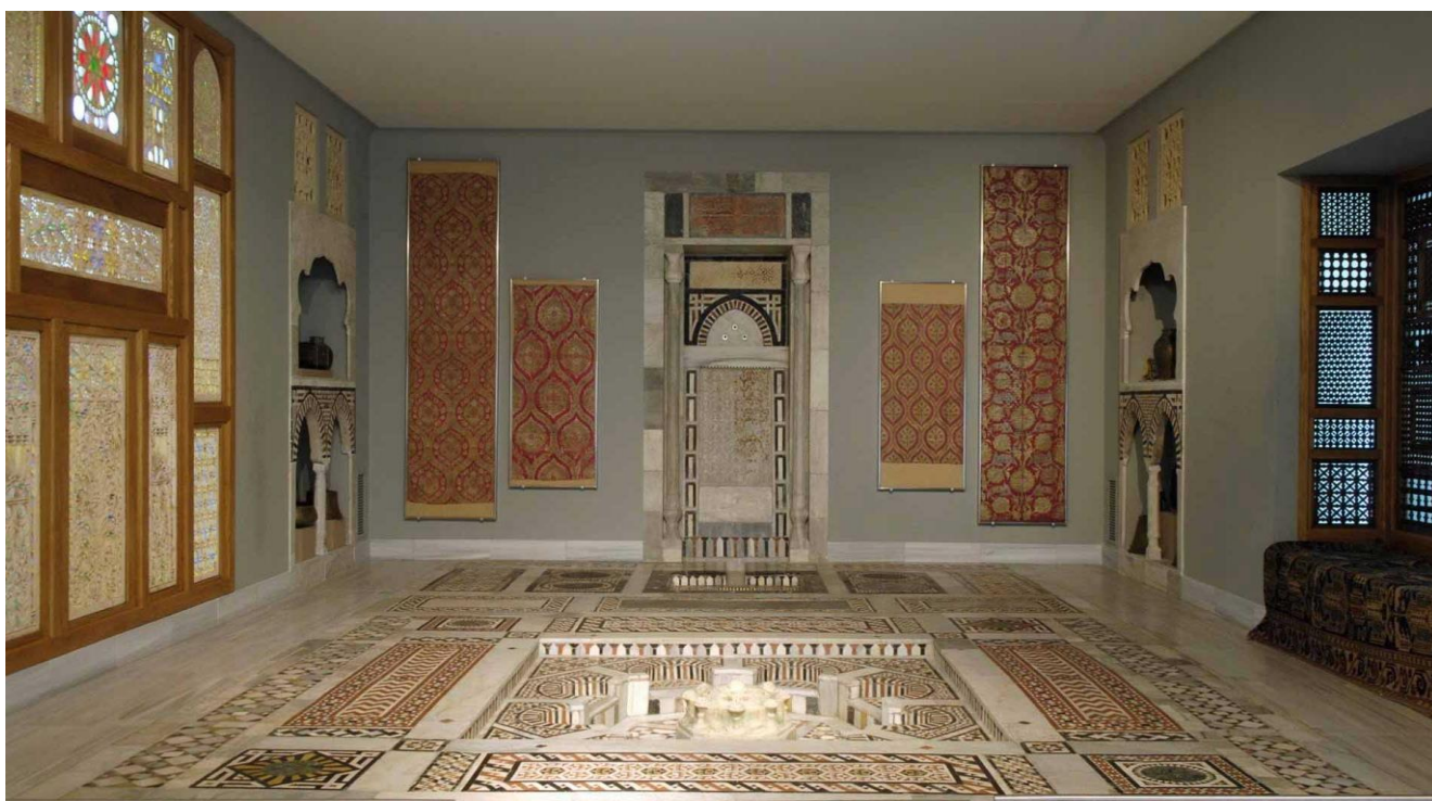
Μουσείο Ισλαμικών Τεχνών – Μουσείο Μπενάκη