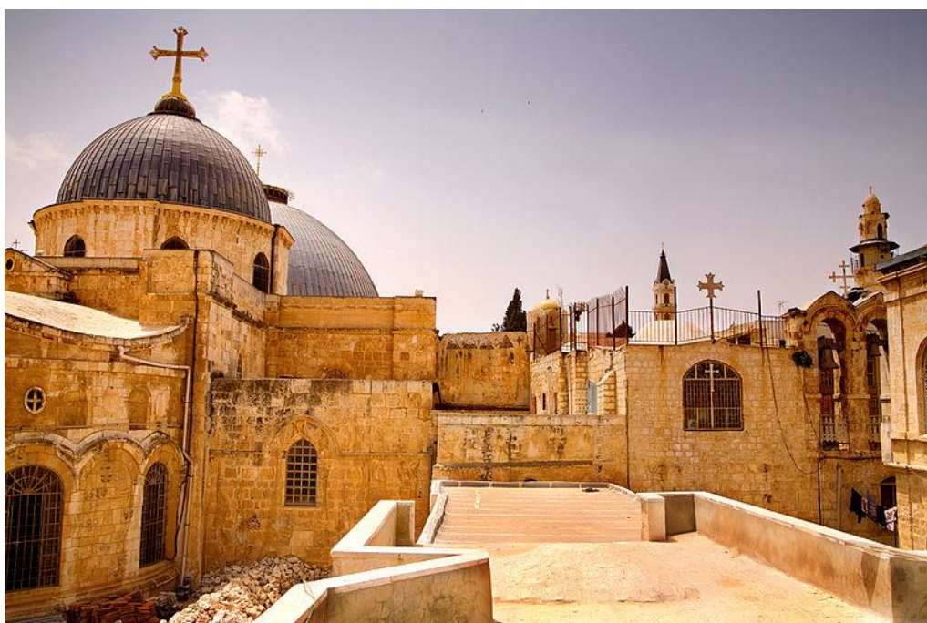
Ο τρούλος απο τον Ναό της Αναστάσεως

Χρησιμοποιήστε τους παραπάνω συνδέσμους για τον οδηγό, που θα δημιουργήσετε με την ομάδα σας!