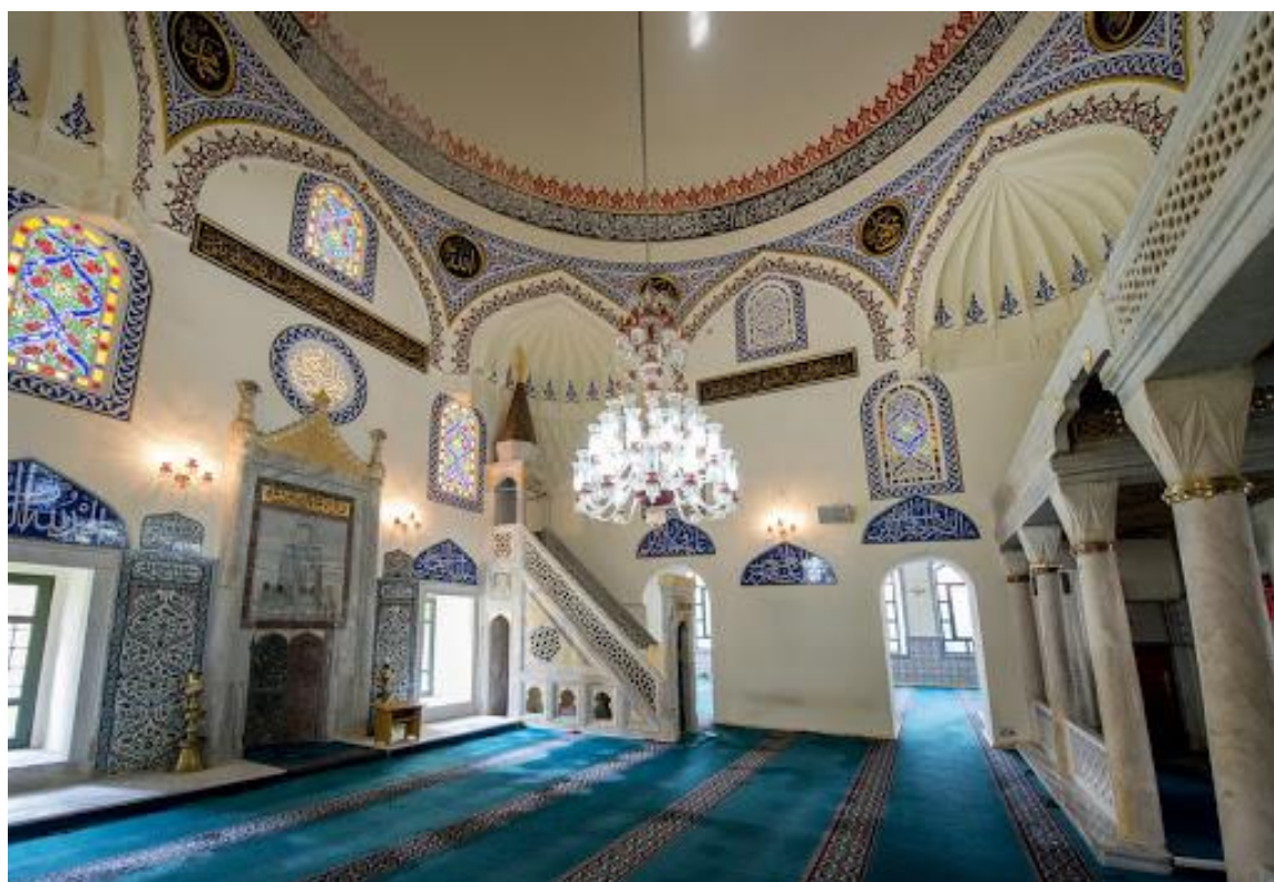
Γενί Τζαμί Κομοτηνής

Τζαμί στην Ιταλία: http://www.archidiap.com/opera/moschea-e-centro-culturale-islamico/