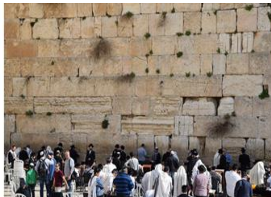
«Shema Israel» – Άκου Ισραήλ (Προσευχή)