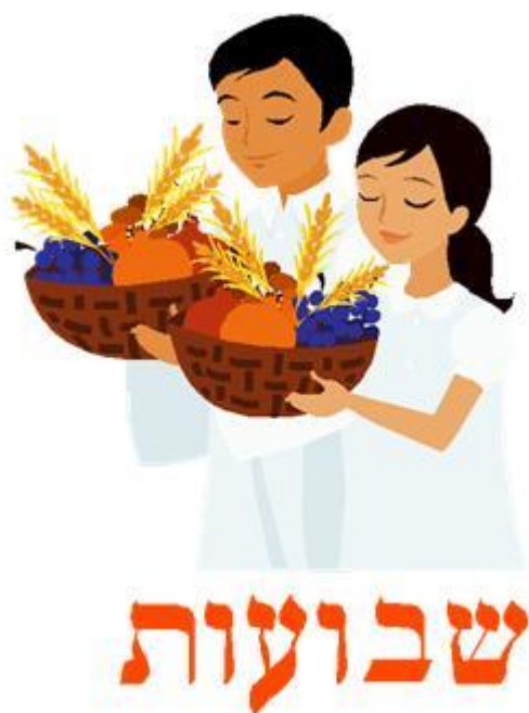
Η Γιορτή του Σαβουότ

Η γιορτή του «Σαβουότ» είναι η Πεντηκοστή των Εβραίων και γιορτάζεται κάθε αρχή του καλοκαιριού. Την ημέρα αυτή υπενθυμίζεται πως έφερναν τη σοδειά της χρονιάς, προσφορά στον Ναό, καθώς επίσης και την ημέρα που ο Θεός έδωσε της Δέκα Εντολές στο Όρος Σινά, ως όρο της Διαθήκης Του με τον λαό του Ισραήλ. Στο βιβλίο της Ρουθ περιγράφεται ο καλοκαιρινός θερισμός και γι' αυτό διαβάζεται την ημέρα αυτή. Τέλος, το έθιμο της ημέρας αυτής για το κάθε σπιτικό, που ασπάζεται αυτήν την πίστη, είναι η κατανάλωση γαλακτερών τροφών που συμβολίζουν τον Νόμο, δηλαδή την Τορά. Άλλωστε, ο Νόμος παρομοιάζεται με το γάλα, το οποίο είναι θρεπτικό και ωφέλιμο για τον άνθρωπο.