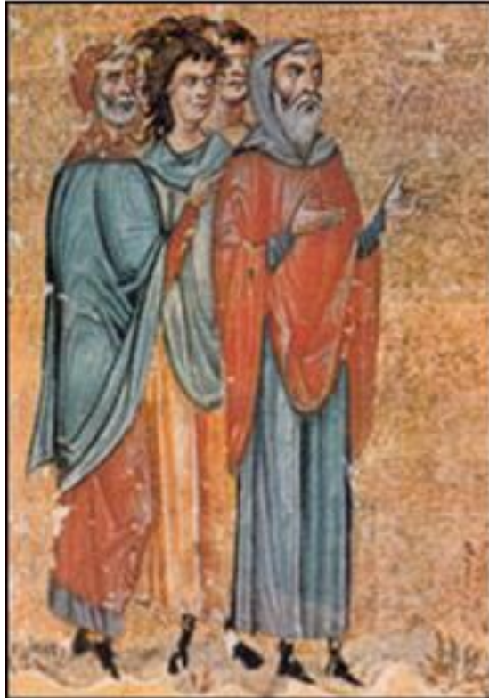
Οι Εβραίοι της Ελλάδας