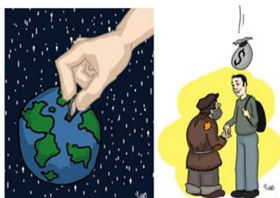
«Τζεντακά» - Φιλανθρωπία