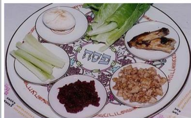
«Κασσέρ» - Επιτρεπόμενες τροφές