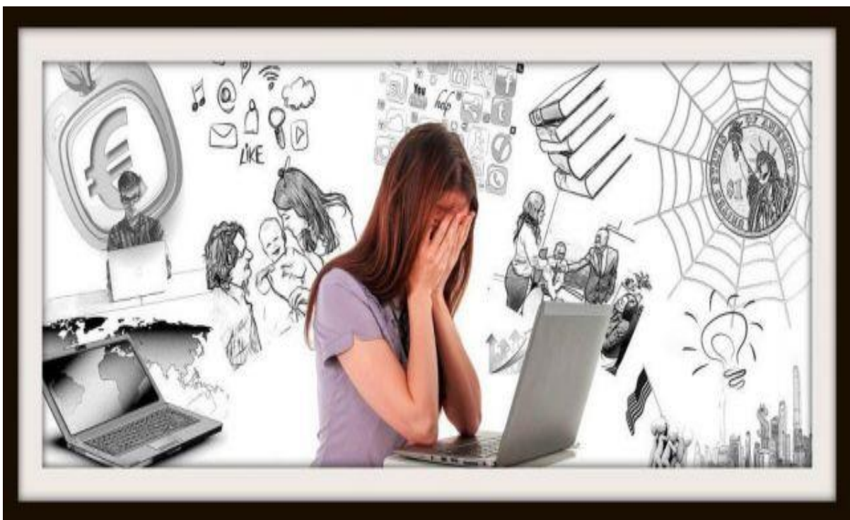
Ο σύγχρονος άνθρωπος

Ο σημερινός άνθρωπος είναι υλιστής και δεν εξασκεί το πνεύμα του. Θεωρεί την ανάγνωση των ιερών κειμένων και την προσευχή ανώφελα. Στην πραγματικότητα, όμως, ο Θεός και το Άγιο Πνεύμα φώτισαν ανθρώπους, για να καταγραφεί η αλήθεια, την οποία είναι σημαντικό να γνωρίζουμε, για να προφυλαχθούμε απο το κακό. Θεωρώ, λοιπόν, πως εάν ο σύγχρονος άνθρωπος έδινε μια ευκαιρία στην Αποκάλυψη του Ιωάννη θα φιλοσοφούσε διαφορετικά τη ζωή του και θα κατανοούσε πως η ζωή, την οποία βιώνουμε αυτή τη στιγμή είναι παροδική. Δεν αξίζει η ζωή μας να αναλλώνεται στα μέσα κοινωνικής δικτύωσης και να εθίζεται στα ηλεκτρονικά, απο τα οποία θα λάβει παροδική χαρά. Αντίθετα, η αιώνια ζωή που αναφέρει ο Ιωάννης περιέχει αιώνια ευτυχία.