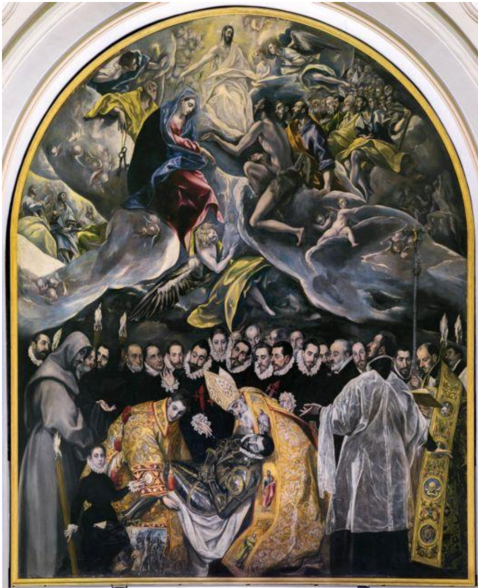
Η ταφή του κόμητα Οργκάθ (λεπτομέρεια, Η ουράνια δόξα), Δομήνικος Θεοτοκόπουλος