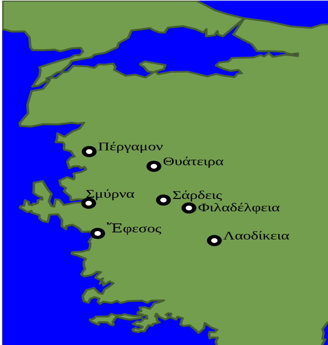
Οι επτά Εκκλησίες της Αποκάλυψης

Αναζητήστε έναν χάρτη της Μικράς Ασίας και πάνω σ' αυτόν σημειώστε τις Εκκλησίες της Αποκάλυψης.