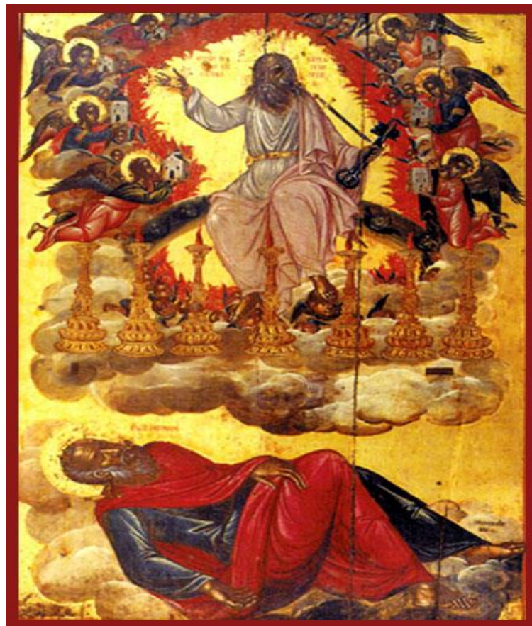
Η Αποκάλυψη του Ιωάννη

Στο άκουσμα της λέξης «Αποκάλυψη» έρχεται στον νου μου το βιβλίο του Ιωάννη. Η «Αποκάλυψή του» αναφέρει σημαντικά μελλοντικά γεγονότα για το τέλος του κόσμου και την αρχή σε μια άλλη ζωή, στον Παράδεισο. Σύμφωνα με το σχολικό εγχειρίδιο, ο Θεός εμπιστέφθηκε τον Ιωάννη και τον έφερε ως «άγγελος» στην γη, για να μας διδάξει τι πρόκειται να συμβεί στο κρίσιμο πέρασμα, απο το τέλος του κόσμου στην αρχή της νέας ζωής. Τέλος, στο έργο αυτό τονίζεται πως σε αυτόν τον κόσμο επικρατεί η αδικία και ο πόνος, αλλά όταν για δεύτερη φορά έρθει ο Χριστός στον κόσμο, όλα θα γίνουν γαλήνια και βασιλεύει μόνο η αγάπη Του.