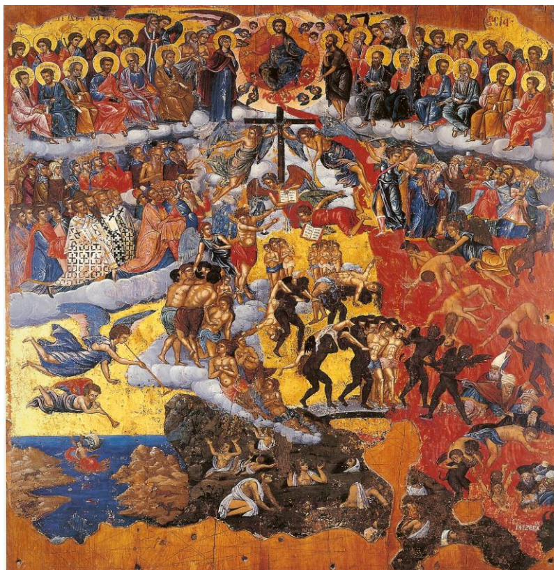
Η Δευτέρα Παρουσία

Ζω την εποχή, που γράφτηκε η Αποκάλυψη. Είμαι Χριστιανός/η και κατοικώ στη Μ. Ασία. Έχοντας μεγάλη πίστη για τον Θεό, αποφασίζω να μελετήσω την «Αποκάλυψη» και ξαφνικά έχω πολλές σκέψεις και συναισθήματα φόβου, αλλά και ηρεμίας. Πιο συγκεκριμένα, μελετώντας την Αποκάλυψη συλλογίζομαι πώς είναι δυνατόν ένας άνθρωπος να έγραψε όλα αυτά τα κείμενα. Ίσως, πράγματι,. Πριν αρχίσω να διαβάζω πίστευα πως πρόκειται για ένα ακόμα κείμενο ενός τρελού, αφού δεν γνώρισα ποτέ κανέναν φωτισμένο. Παρ' όλα αυτά, καθώς διάβαζα τα κείμενα, σκέφτηκα πως όλα αυτά γράφτηκαν απο κάποιον, που τον φώτισε ο Θεός. Όσα είναι γραμμένα εκεί άγγιξαν την ψυχή μου. Τα συναισθήματά μου όσο διαβάζω είναι άγχος και φόβος, αλλά όχι για πολύ. Αγχώνομαι για όλα όσα γράφεται ότι θα συμβούν, αλλά απο την άλλη πλευρά αισθάνομαι ηρεμία, γιατί θα έρθει η Δευτέρα Παρουσία, κατά την οποία όλα θα αλλάξουν και το κακό θα ηττηθεί.