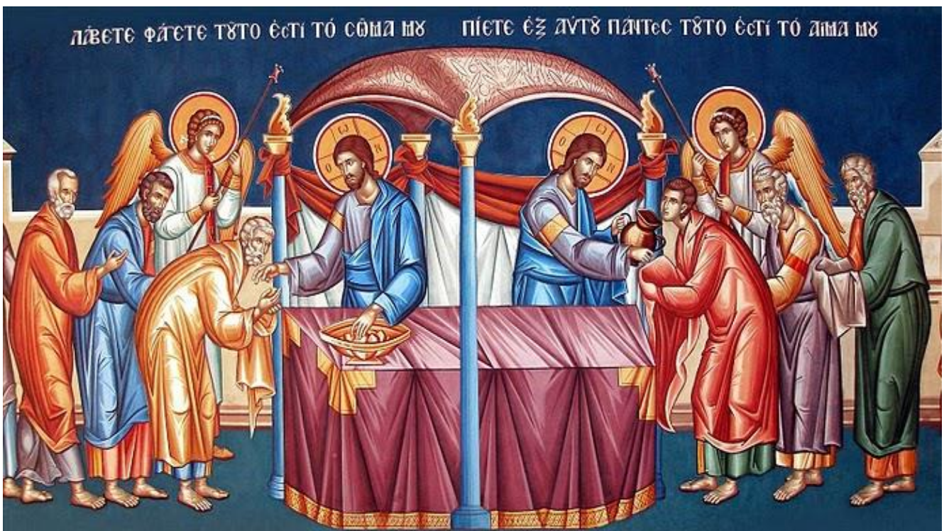
Η Θεία Μετάληψη

Στα βιβλικά κείμενα, η βασιλεία του Θεού συχνά συμβολίζεται με ένα δείπνο ή ένα τραπέζι. Σύμφωνα με το κείμενο του Μητροπολίτη Περγάμου, η Θεία Ευχαριστία είναι «εικόνα της βασιλείας του Θεού». Αυτές οι δύο προσεγγίσεις συνδέονται ως εξής. Κατά τον Μυστικό Δείπνο, ο Χριστός αφιέρωσε το σώμα και το αίμα Του, για να σωθεί η ανθρωπότητα. Συνεπώς, ο Θεός συνέδεσε εξ αρχής το τραπέζι του Μυστικού Δείπνου, με τη βασιλεία του Θεού. Όσον αφορά, τις προεκτάσεις αυτής της σχέσης στη ζωή των πιστών είναι οι ακόλουθες. Εφόσον ο Κύριος χάρισε τη ζωή Του και θυσιάστηκε για τον κόσμο, έτσι οι πιστοί επιθυμούν μέσα από τη ζωή τους να θυσιάζονται για τον πλησίον τους και να αγωνίζονται για το καλό και το δίκαιο. Συνεπώς, η Θεία Ευχαριστία αποτελεί μεγάλο Μυστήριο για την Εκκλησία και τη ζωή των πιστών.