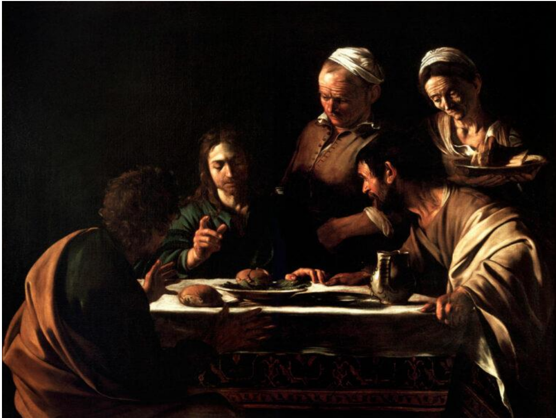
Δείπνο στους Εμμαούς (Caravaggio, 1606)

-Εγώ: Έσκυψα το κεφάλι και έφυγα έχοντας πειστεί πως είναι ο Μεσσίας.