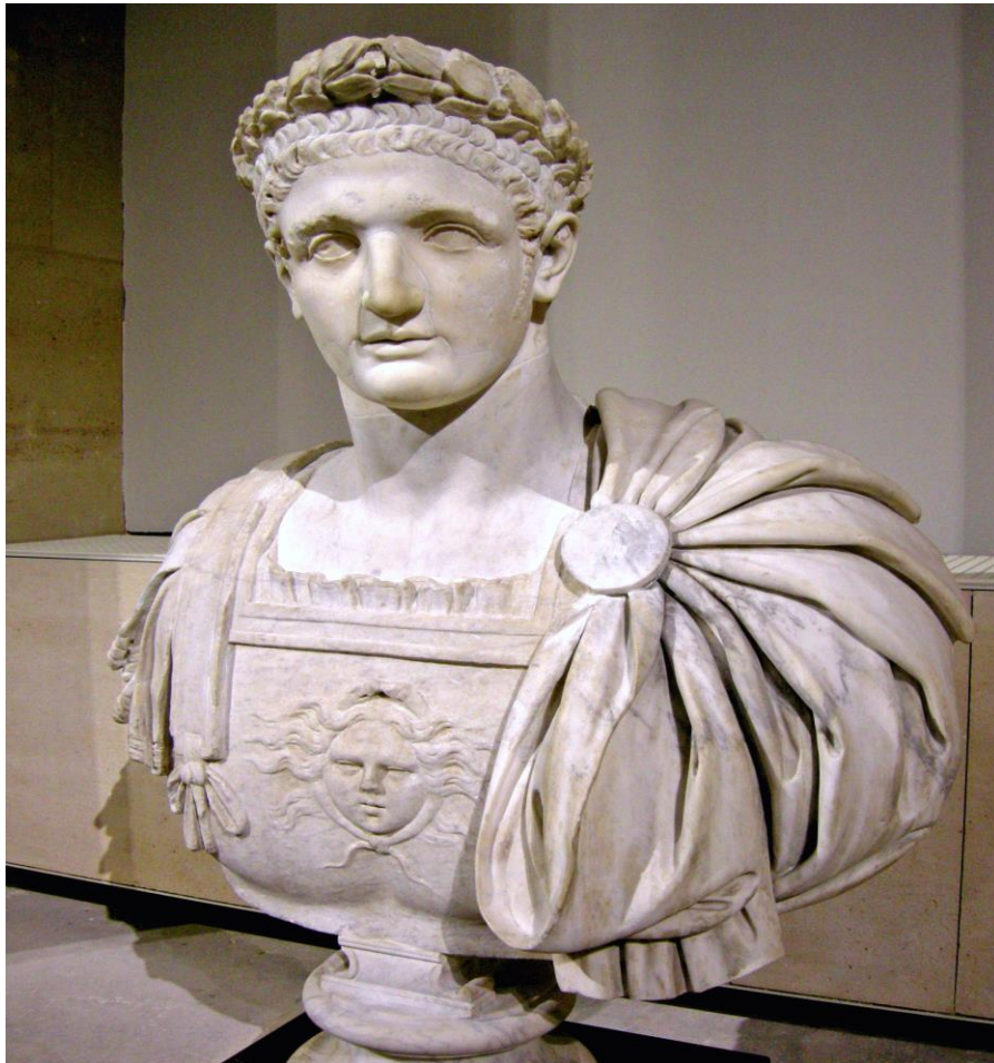
Τίτος Φλάβιος Δομιτιανός, 24 Οκτωβρίου 51 - 18 Σεπτεμβρίου 96 Ρωμαίος αυτοκράτορας

Τα ιστορικά στοιχεία τα οποία είναι γνωστά για τον Ιωάννη είναι τα ακόλουθα. Αρχικά, ο Ιωάννης βρισκόνταν, κατά τον 1 ο αι. μ. Χ., στην Έφεσο της Μ. Ασίας, όπου εκεί ξεκίνησε τη συγγραφή της «Αποκάλυψης». Όμως, ο αυτοκράτορας της Ρώμης, Δομιτιανός έδωσε διαταγή να λατρεύεται αυτός ως Θεός. Αγαπούσε τον Θεό και αρνήθηκε τις εντολές του αυτοκράτορα. Έτσι, ο Ιωάννης κατέληξε στην εξορία. Τον έστειλαν σε έναν αγόνο νησί των Δωδεκανήσων την Πάτμο, όπου εκεί έζησε και την υπόλοιπή του ζωή.