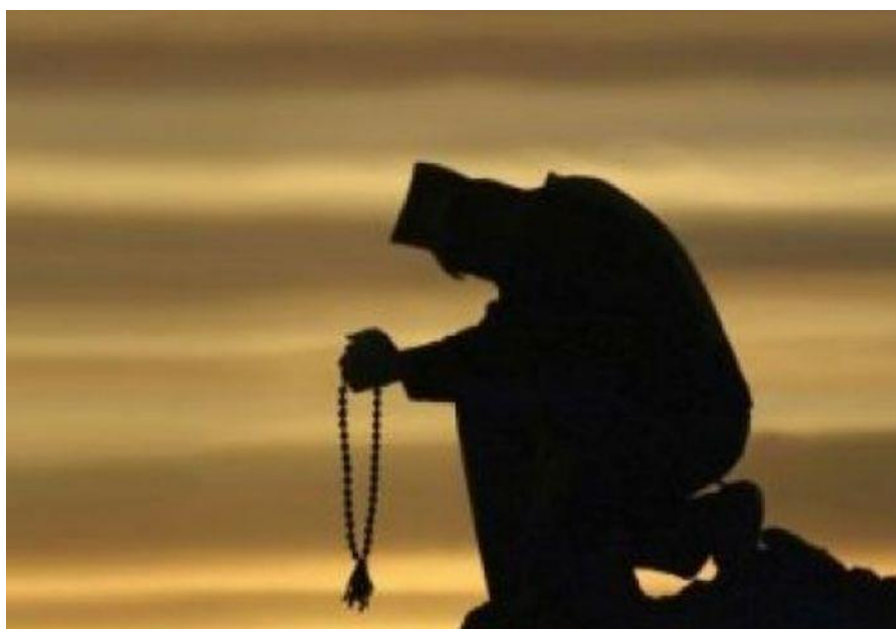
Η προσευχή ως τροφή της ψυχής