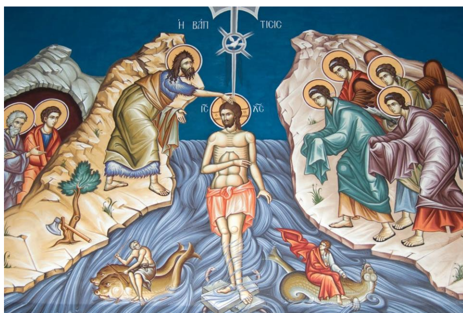
Η Βάπτιση του Ιησού