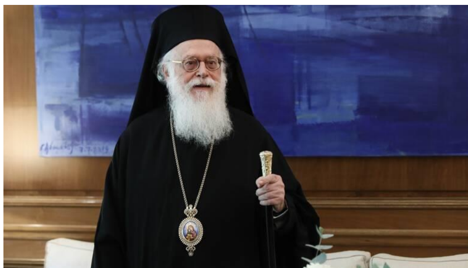
Αρχιεπίσκοπος Αλβανίας, κ. κ. Αναστάσιος

Χρησιμοποιήστε τους παραπάνω συνδέσμους για τις πληροφορίες, που απαιτούνται!