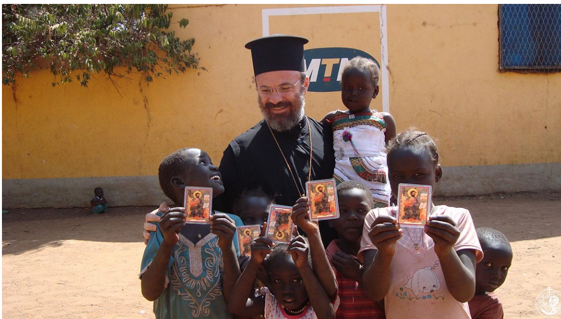
Αδελφότητα Ορθόδοξης Ιεραποστολής

http://www.apostoliki-diakonia.gr/gr_main/catehism/theologia_zoi/themata.asp?cat=afier&NF=1&contents=contents_Ierapostoli.asp&main=ierapostoli&file=8.htm