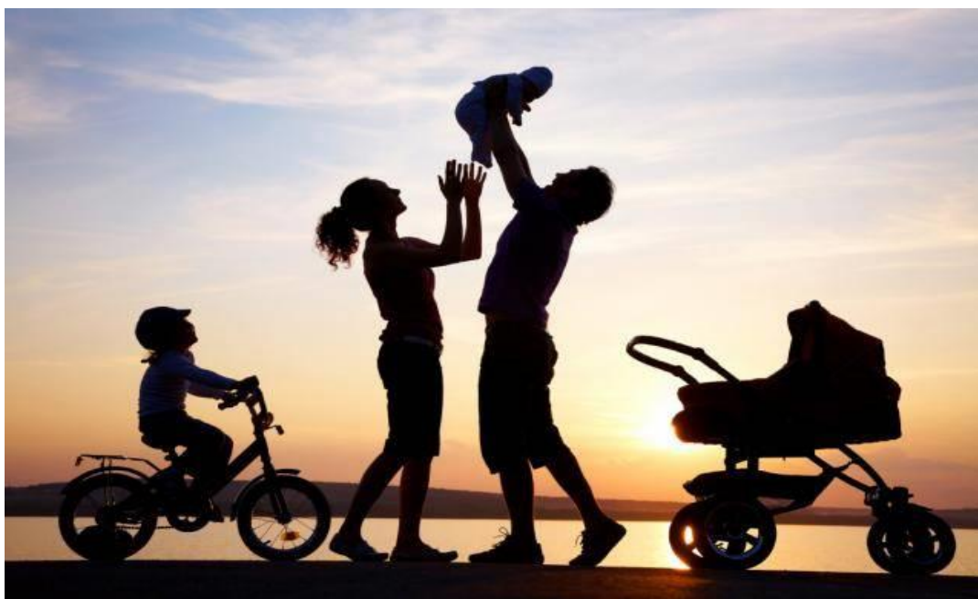
Παγκόσμια Ημέρα Οικογένειας, 15 Μαΐου