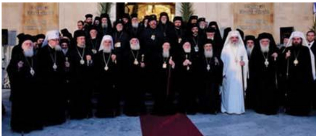
Προκαθήμενοι Ορθοδόξων Εκκλησιών κατά την παραμονή της Αγίας και Μεγάλης Συνόδου, Αγ. Τίτος Ηρακλείου, Κρήτη, 2016

*Πριν τη διάσπαση της Δυτικής με την Ανατολική Εκκλησία τα Πατριαρχεία ήταν Πέντε, καθώς συνυπολογίζονταν το Πατριαρχείο της Ρώμης κι αποτελούσαν όλα μαζί την «Πενταρχία».