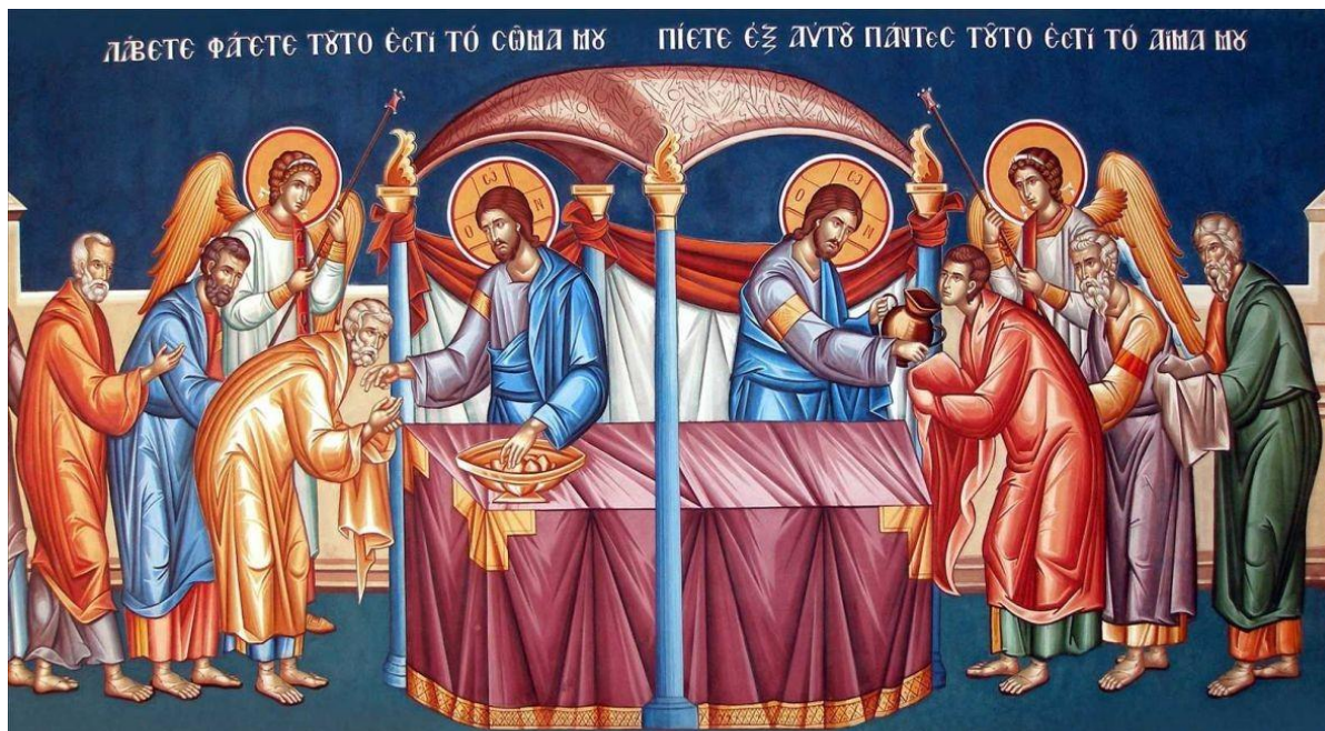
Το Μυστήριο της Θείας Ευχαριστίας

3 ος Τρόπος: Όταν ένα μέλος του ανθρωπίνου σώματος πονάει, υποφέρει ολόκληρο το σώμα. Αντίστοιχα, όταν ένα μέλος της Εκκλησίας πάσχει, τότε υποφέρει όλο το σώμα της Εκκλησίας.