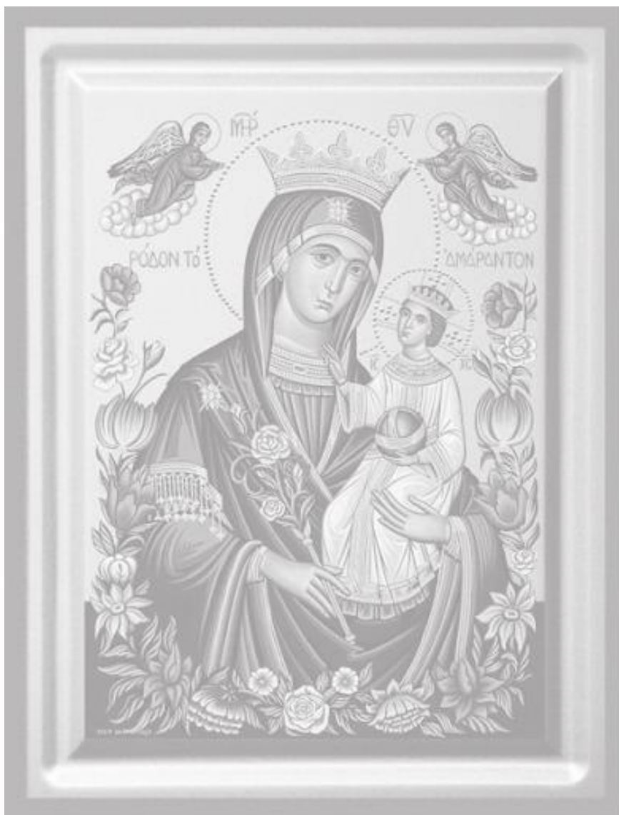
Παναγία, Ρόδο το Αμάραντο