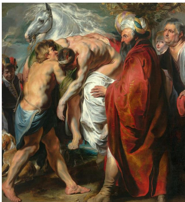
«Ο καλός Σαμαρείτης», πίνακας του Γιάκομπ Γιόρντενς, περ. 1616

http://www.pspa.eu/images/files/epaideutiko-yliko/bgymn/paraboli_samariti.pdf