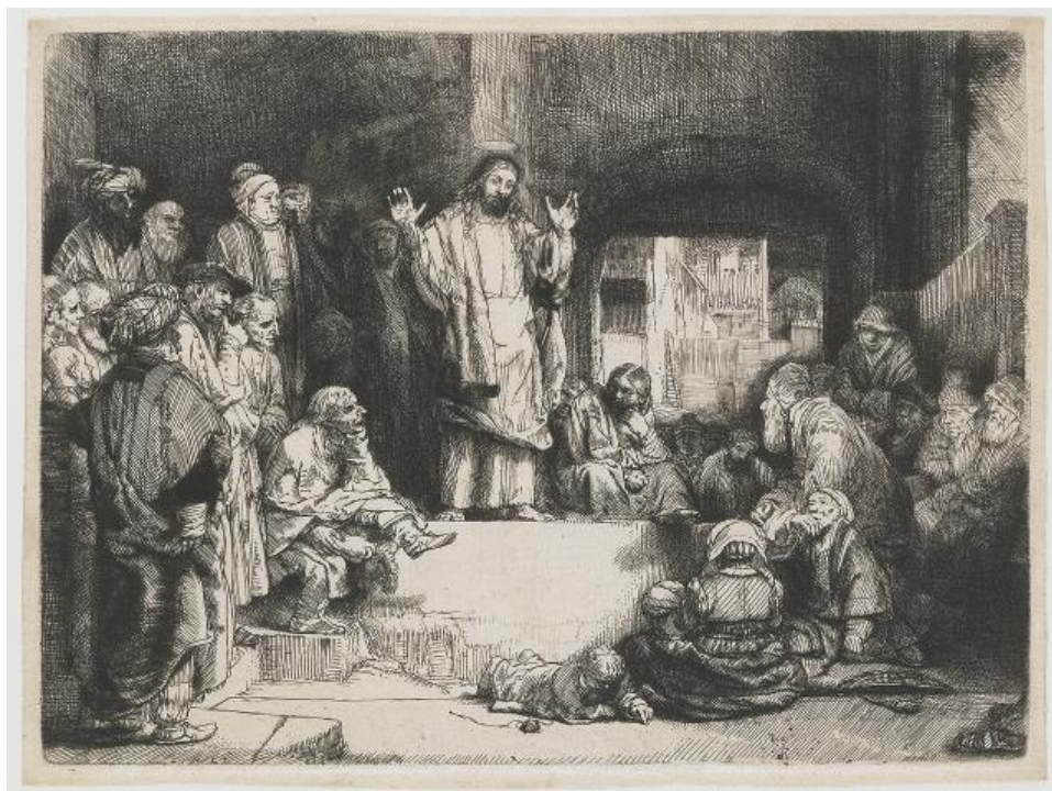
Ο Χριστός διδάσκων, χαρακτηριστικό του Ρέμπραντ.

Στο χαρακτηριστικό του Ρέμπραντ με προβληματίζουν δύο πρόσωπα. Το πρώτο πρόσωπο είναι το παιδί, που είναι μπρούμυτα στο πάτωμα και φαίνεται να μη νοιάζεται για όσα λέει ο Χριστός. Το δεύτερο πρόσωπο είναι ο γέρος, ο οποίος κάθεται, με το χέρι στο σαγόνι του σαν να σκέφτεται όσα είχε ζήσει στη ζωή του. Τα υπόλοιπα πρόσωπα φαίνονται να δίνουν σημασία στη διδασκαλία του Χριστού και να Τον κοιτούν με προσοχή.