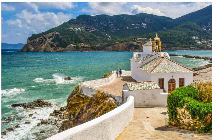
Παναγίτσα του Πύργου, Σκόπελος

Η σημερινή ημέρα ξεκίνησε όπως όλες οι υπόλοιπες ημέρες. Σηκώθηκα και ξεκίνησα για το σχολείο. Όσο περπατούσα, πλάι στη θάλασσα, σκεφτόμουν πως τα πάντα γύρω μας τα δημιούργησε ο Θεός και Τον ευγνωμονούσα για τη νέα ημέρα που ξημέρωσε. Εκείνη τη στιγμή, ένιωσα ένα χέρι στον δεξιό μου ώμο και τότε γύρισα πίσω, να δω ποιος με ακούμπησε. Ήταν κάποιος με λευκά ρούχα που με κοίταζε και ήξερε το όνομά μου. Μου είπε «Είμαι ο δημιουργός του κόσμου! Άκουσα τη σκέψη σου και την προσευχή σου κι αποφάσισα να σε καλέσω κοντά μου και να γίνεις μαθητής μου! Θα επιλέξω για μαθητή μου όποιον πραγματικά πιστεύει σε εμένα! Η επιλογή είναι δική σου!». Άνοιξε η καρδιά μου μόλις άκουσα αυτά τα λόγια απο τον Ιησού. Τον πίστεψα κι αποφάσισα να Τον ακολουθήσω χωρίς να διστάσω. Άκουσε την προσευχή μου την στιγμή που τον ευγνωμονούσα κι έτσι μού έδωσε μια ευκαιρία για τη ζωή μου! Από εδώ και πέρα όλα θα είναι αλλιώς!