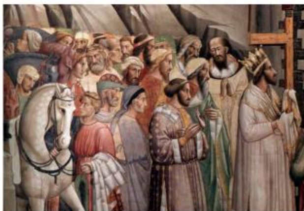
Agnolo Gadde, Η είσοδος του Ηρακλείου στην Ιερουσαλήμ