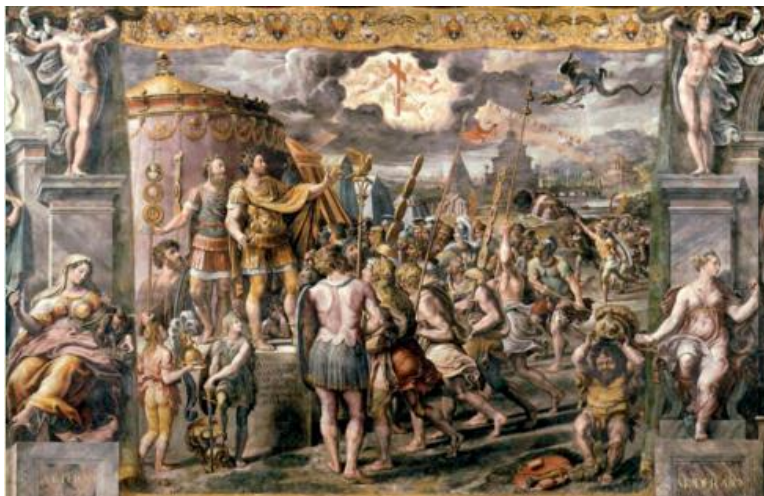
Ραφαήλ, Το όραμα του Κωνσταντίνου. Φρέσκο του 1520, Βατικανό

ΑΝΑΖΗΤΗΣΕ ΕΠΕΚΤΕΙΝΕ: Ποιες ερωτήσεις, σκέψεις ή απορίες σου προκαλεί το έργο του Ραφαήλ; Τι άλλο θα ήθελες να αναζητήσεις σχετικά με το έργο ή το θέμα που αναπαριστά;