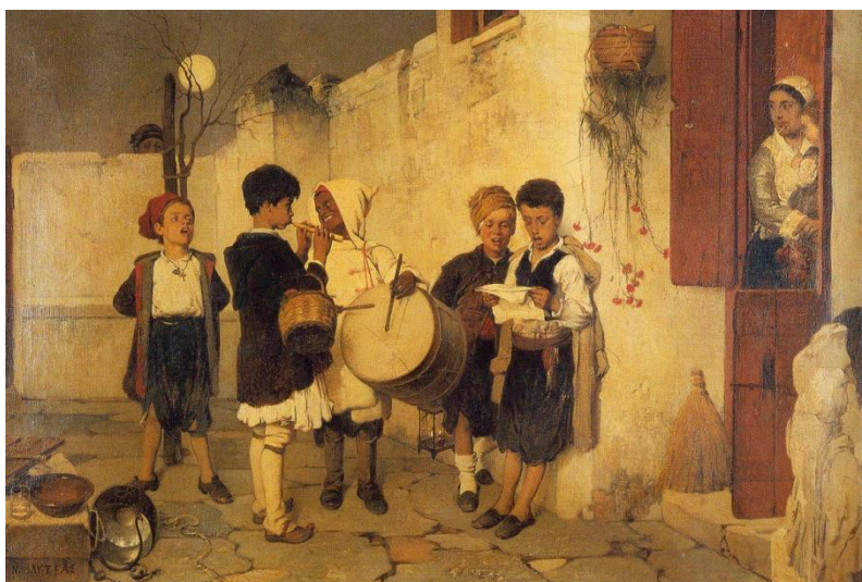
Κάλαντα, πίνακας του Νικηφόρου Λύτρα (1872)