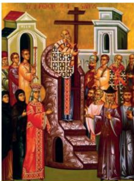
Η Ύψωση του Τιμίου Σταυρού

Η πρώτη περίπτωση αφορά την εύρεση του Τιμίου Σταυρού, ενώ η δεύτερη αφορά την επιστροφή του στο Ιεροσόλυμα.