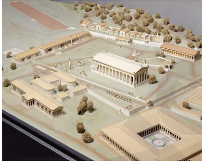
Εικ. 2. Μακέτα του Ιερού του Διός στην Ολυμπία από το Αρχαιολογικό Μουσείο Ολυμπίας

http://odysseus.culture.gr/h/3/gh3562.jsp?obj_id=2358&mm_id=4047