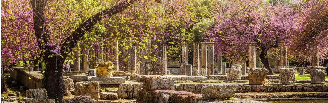
Εικ.8: Αρχαιολογικός χώρος Ολυμπίας

το ιερό του Απόλλωνα μέσω της αρχαίας Ιεράς Οδού, Θησαυρούς, ανάμεσα τους τον περίφημο Θησαυρό των Σιφνίων και των Αθηναίων, τη Στοά των Αθηναίων και τον Αναλημματικό Τοίχο και τέλος, στο τέρμα του μονοπατιού τον ναό του Απόλλωνα. Πιο πάνω στον λόφο συναντάμε το Αρχαίο θέατρο και το Στάδιο. 17