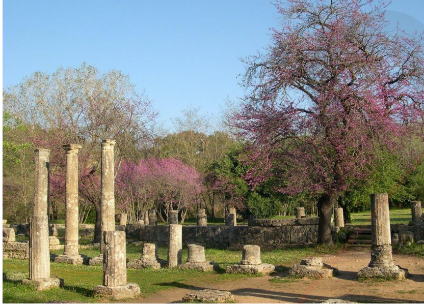
Εικ.3: Αρχαιολογικός Χώρος Ολυμπίας

Το ιερό του Ολύμπιου Δία και κοιτίδα των Ολυμπιακών Αγώνων απλώνεται σε μια ειδυλλιακή κοιλάδα της δυτικής Πελοποννήσου, στην ένωση των ποταμών Αλφειού και Κλαδέου. Στην αρχαιότητα, η κοιλάδα αυτή ήταν κατάφυτη με πεύκα, πλατάνια και αγριελιές, για αυτό και το τέμενος του θεού ονομάστηκε Άλιτις . Η απαρχή της λατρείας και των μυθικών αναμετρήσεων που έλαβαν χώρα στην Ολυμπία χάνεται στα βάθη των αιώνων. Οι τοπικοί μύθοι σχετικά με τον Πέλοποα, τον ισχυρό βασιλιά της περιοχής και τον ποτάμιο θεό Αλφειό, φανερώνουν τους ισχυρούς δεσμούς που διατηρούσε το ιερό τόσο με την Ανατολή όσο και με τη Δύση. 7