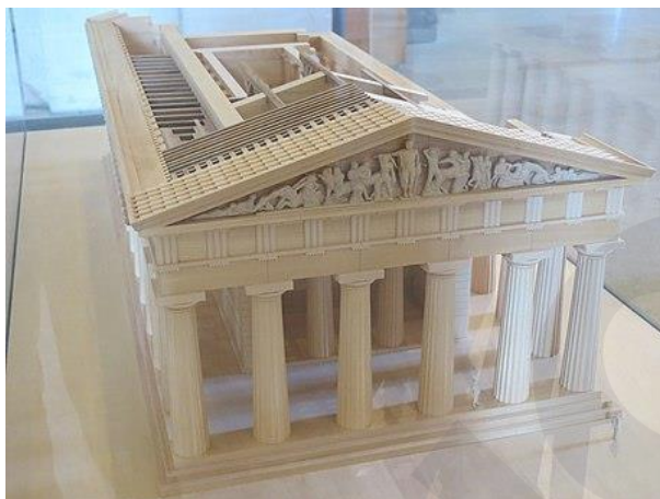
Εικ.5: Ναός Δία Ολυμπίας

https://el.wikipedia.org/wiki/%CE%9D%CE%B1%CF%8C%CF%82_%CF%84%CE%BF%CF%85_%CE%94%CE%AF%CE%B1_%CF%83%CF%84%CE%B7%CE%BD_%CE%9F%CE%BB%CF%85%CE%BC%CF%80%CE%AF%CE%B1