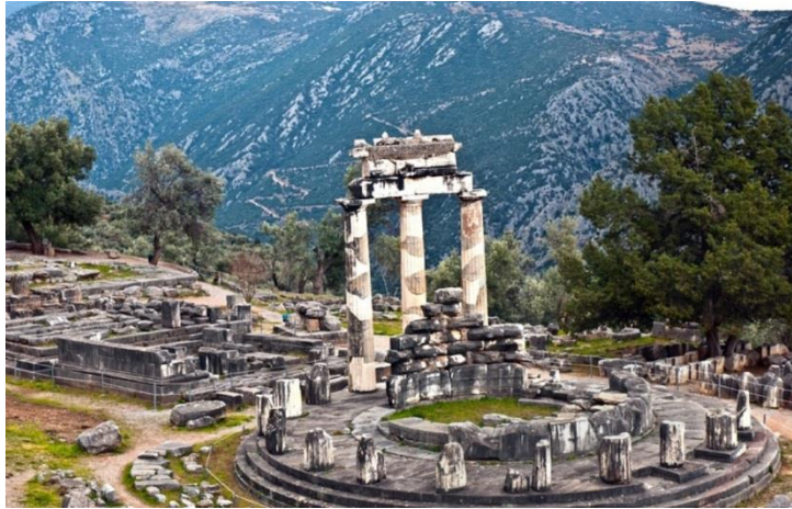
Εικ.7: Αρχαιολογικός χώρος Δελφών

Η επιλογή των Δελφών για την ανοικοδόμηση του ναού και μαντείου του Απόλλωνα στην αρχαιότητα δεν ήταν τυχαία, όπως τυχαίος δεν ήταν και ο χαρακτηρισμός τους ως «ομφαλός της γης». Η τοποθεσία παρουσιάζει μια εξαιρετική δυναμική, με έντονη ενεργειακή φόρτιση, οχυρή θέση σε συνδυασμό με μοναδική θέα στον κόλπο της Ιτέας, πλούσια βλάστηση, πηγές και κομβική γεωγραφική τοποθέτηση. Η επιβλητικότητα του αρχαιολογικού χώρου είναι αξεπέραστη χάρη στα απομεινάρια κτηρίων της αρχαιότητας που φτάνουν στα όρια του μύθου, τη φοβερή μυσταγωγική διαδικασία της χρησμοδοσίας που λάμβανε χώρα εδώ, την ιερότητα και τον σεβασμό με τον οποίο αντιμετώπιζαν το Μαντείο οι Αρχαίοι, αλλά και το μοναδικό Δελφικό Τοπίο, στοιχεία που συνθέτουν μια εικόνα που κατατάσσεται στις «εμπειρίες ζωής». Ο αρχαιολογικός χώρος εκτείνεται σε όλη την πλαγιά του λόφου και είναι διάσπαρτος από έργα τέχνης και μνημεία, σχεδόν σε κάθε βήμα του επισκέπτη, που θα χρειαστεί αρκετό χρόνο για την ανάβαση. Αυτό που εντυπωσιάζει ήδη από μακριά είναι οι αρχαίοι κάθετοι βράχοι που «οριοθετούν» το Δελφικό Τοπίο: πρόκειται για τις Φαιδριάδες Πέτρες, που έχουν την δική τους θέση στην ιστορία του Μαντείου, καθώς από εκεί κατακρημνίζονταν οι βέβηλοι. Φτάνοντας από Αθήνα συναντάμε πρώτα τον ναό της Αθηνάς Προναίας, το Γυμνάσιο, την Κασταλία Πηγή,