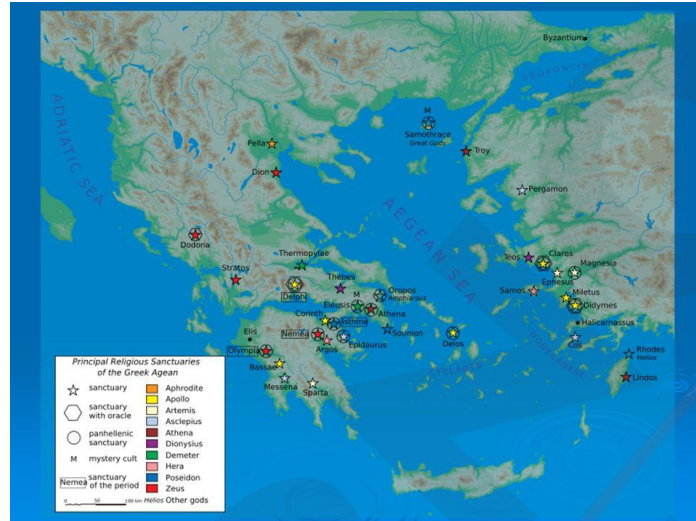
Εικ. 1. Πανελλήνια Ιερά https://slideplayer.gr/slide/2894570/

Τον 8 ο π.Χ. αιώνα γνώρισαν μεγάλη ανάπτυξη και έλαβαν πανελλήνιο χαρακτήρα τα μεγάλα ιερά, όπως το ιερό της Ολυμπίας, της Δωδώνης, των Δελφών, της Δήλου και το Ηραίο της Σάμου. Τα περισσότερα ήταν κτισμένα πάνω σε παλαιότερους μυκηναϊκούς τόπους λατρείας, όπου ο βωμός περιβαλλόταν από στρώματα στάχτης. Οι θεότητες που λατρεύονταν ήταν αυτές των μυκηναίων. Τα ιερά αποτελούσαν πανελλήνιους τόπους λατρείας και δέχονταν αναθήματα τόσο από τους τοπικούς πληθυσμούς, όσο και από όλη την Ελλάδα και τις αποικίες. Μετά την πόλη τα πανελλήνια ιερά έρχονταν πρώτα στη συνείδηση των πολιτών. Οι καλλιτέχνες επιδείκνυαν εκεί τα καλλιτεχνικά ρεύματα και το πνεύμα του ανταγωνισμού των πόλεων για ποιοτική ανωτερότητα. Απόρροια αυτού ήταν η δημιουργία ενός αρχαϊκού ιδεώδους το οποίο προέτασσε την κυριαρχία ενός νοητού κράτους όλων των Ελλήνων. 1