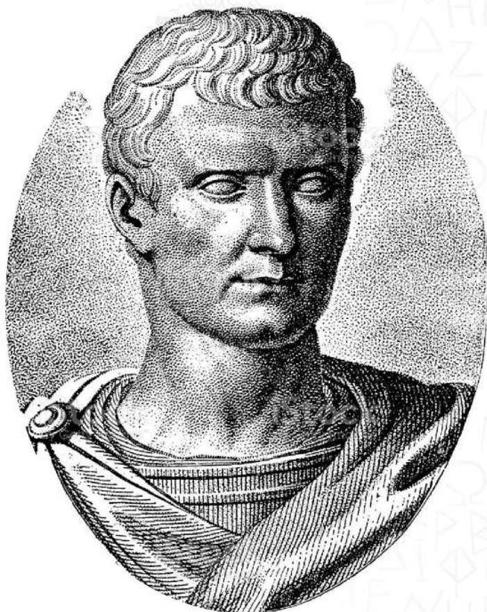
MARCUS TULLIUS CICERO 106 ΠΧ-43 ΠΧ