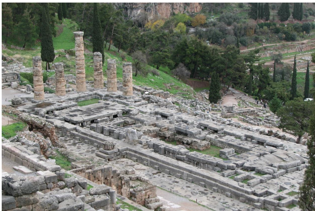
Εικ. 2: Ιερό του Πυθίου Απόλλωνος στους Δελφούς.

Η εργασία σας θα πρέπει να έχει έκταση έως 1800 λέξεις (με απόκλιση 200 λιγότερες ή περισσότερες), να είναι καλά δομημένη και τεκμηριωμένη, και να περιλαμβάνει απαραίτητως συνοδευτικές εικόνες (βλ. συμβουλές παρακάτω). Οι σημειώσεις δεν προσμετρώνται στην έκτασή της.