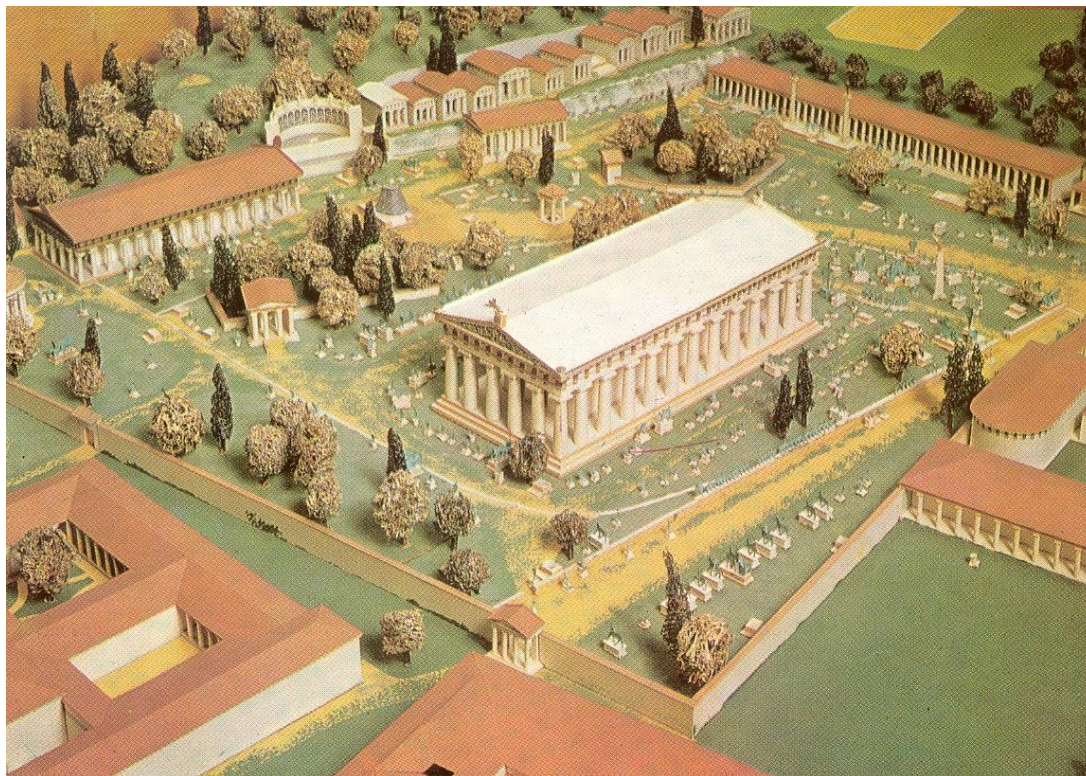
Εικ. 1: Ιερό του Διός στην Ολυμπία (πρόπλασμα).

Ήδη από τον 8 ο αι. π.Χ., τα ιερά πανελληνίας εμβέλειας λειτούργησαν στον ελλαδικό χώρο ως «θρησκευτικά, εθνικά και καλλιτεχνικά κέντρα» (ΕΜ1, σελ. 155). Εκτός από διαφορετικούς τύπους κτισμάτων που εξυπηρετούν λατρευτικούς και λειτουργικούς σκοπούς, τα ελληνικά ιερά συγκεντρώνουν και πλήθος αναθημάτων, μέσα από τα οποία διαμορφώνεται σταδιακά η κοινή αισθητική γλώσσα της αρχαίας ελληνικής τέχνης.