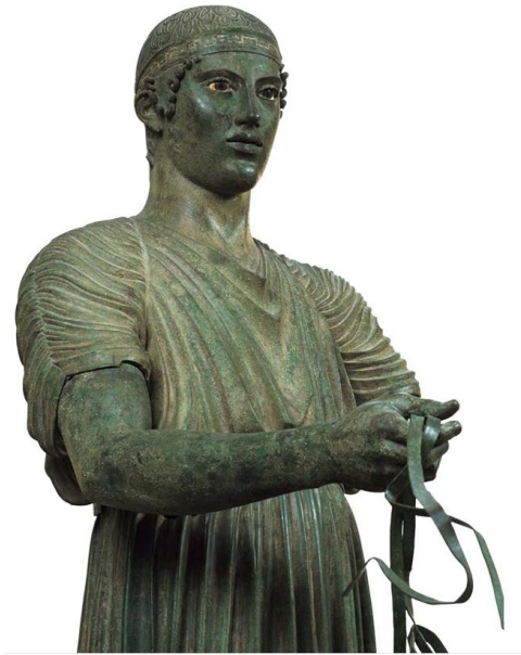
Εικ. 3: Ορειχάλκινο άγαλμα ηνιόχου από τους Δελφούς.