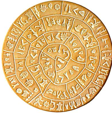
Ο δίσκος της Φαιστού

βρέθηκαν πινακίδες που μας δίνουν πλήθος ιστορικών πληροφοριών για την περίοδο αυτή.