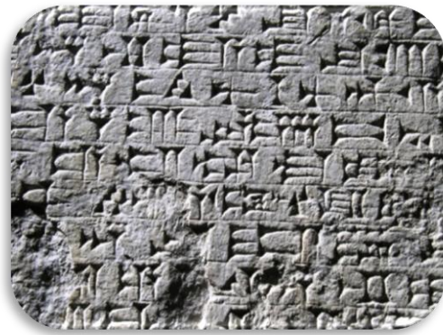
Η σφηνοειδής γραφή

Οι Σουμέριοι εγκαταστάθηκαν την 4η χιλιετία π.Χ. στην περιοχή της Μεσοποταμίας και ήταν ο πρώτος λαός στον κόσμο που ανέπτυξε υψηλό πολιτισμό. Ανάμεσα στα άλλα επιτεύγματά τους περιλαμβάνεται και μια μορφή γραφής, η σφηνοειδής . Οι Σουμέριοι χρησιμοποιούσαν μια γραφίδα με την οποία έγραφαν πάνω στον νωπό πηλό. Το αποτύπωμα που άφηνε η γραφίδα έμοιαζε με σφήνα και γι' αυτό και η γραφή ονομάστηκε σφηνοειδής. Η