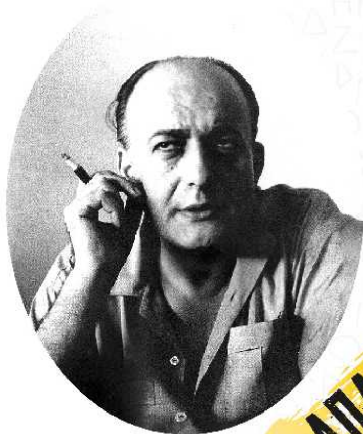
ΝΙΚΟΣ ΓΚΑΤΣΟΣ 1914-1992