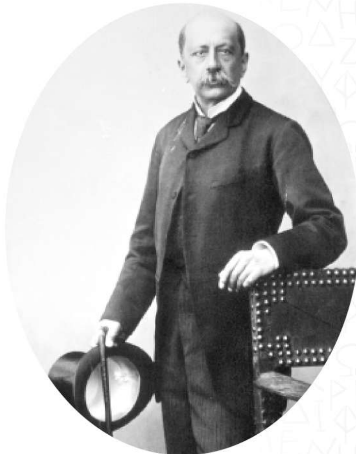
ΤΡΙΚΟΥΠΗΣ ΧΑΡΙΛΑΟΣ 1832-1896