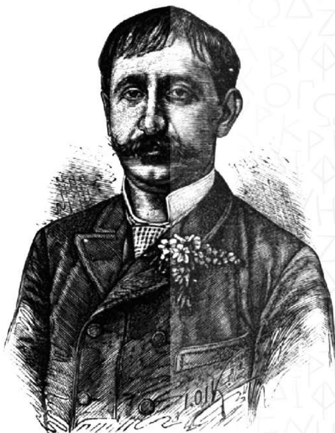
ΓΙΑΝΝΗΣ ΨΥΧΑΡΗΣ 1854-1929