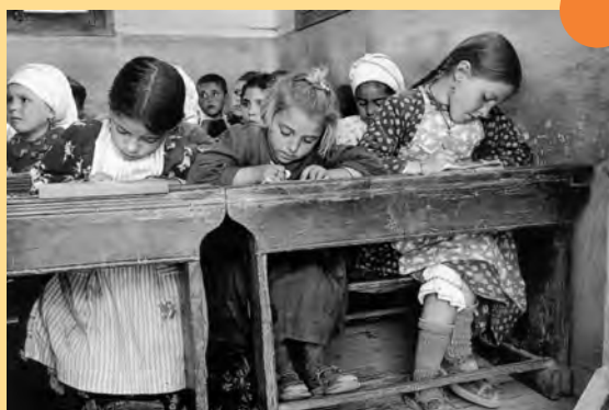
Μια σχολική τάξη στα χρόνια του πολέμου

«Τ' αγοράζανε τα παιδιά τα βιβλία, αλλά εμένα δε μου παίρναν οι γονείς μου. Ήμουν πάντα αδιάβαστη. Ό,τι μάθαινα, το μάθαινα από τον δάσκαλο. Σκέψου ότι ένα μολύβι το έκοβε η μάνα μου στα τρία, για να πάρουμε οι τρεις αδελφές από ένα κομματάκι. Ο δάσκαλος μου έμαθε την προπαίδεια κι ήμουν τόσο άσος στην αριθμητική που τα έβρισκα με δικό μου τρόπο τα προβλήματα. Και λέγανε αυτό το παιδί θα γίνει ευφυΐα. Άμα δεν έχεις βιβλία, να δεις ευφυΐα που γίνεσαι! Γράφτηκα στην Έκτη, αλλά κηρύχτηκε ο πόλεμος με τους Ιταλούς».