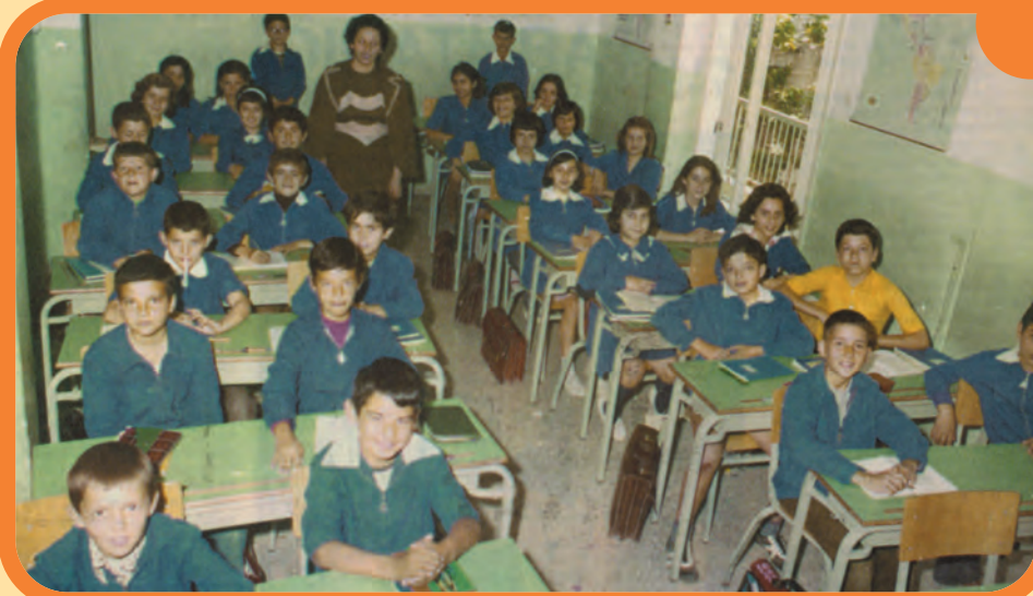
Μια σχολική τάξη του 1970