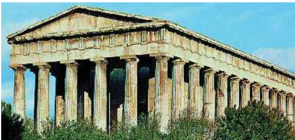
2. Ο ναός του Ηφαίστου, το γνωστό Θησείο. Εδώ κατέφευγαν πολλές φορές οι δούλοι ζητώντας βοήθεια από το θεό.

Στην Αθήνα ζούσαν και αρκετοί δούλοι, που έκαναν όλες τις βαριές δουλειές. Πολλοί απ' αυτούς ήταν αιχμάλωτοι. Η ζωή τους ήταν δύσκολη και κοπιαστική. Αν ένας δούλος είχε παράπονα από τον αφέντη του, μπορούσε να καταφύγει σ' ένα ναό και να ζητήσει προστασία. Μετά ήταν δυνατό να πουληθεί σε άλλο αφέντη, χωρίς όμως να είναι βέβαιο ότι θα καλύτερέψει η ζωή του. Γενικά η ζωή των δούλων στην Αθήνα, σε σύγκριση με τη ζωή άλλων σε διάφορες πόλεις, ήταν πιο καλή. Πολλοί δούλευαν ως αστυνομικοί, λογιστές και παιδαγωγοί.