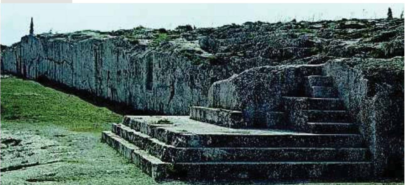
1. Ο λόφος της Πνύκας ήταν ο χώρος όπου συνεδρίαζε η Εκκλησία του δήμου. Στην εικόνα φαίνεται το σημείο όπου στέκονταν όσοι μιλούσαν.

Οι κάτοικοι της Αττικής χωρίζονταν σε κατηγορίες. Αθηναίοι πολίτες