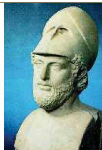
3. Ο Περικλής (Λονδίνο, Βρετανικό Μουσείο)

Θουκυδίδης, Ιστορία, Β, 65 8-10 (διασκευή)