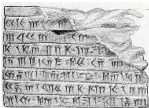
7. Επιγραφή σε σφηνοειδή γραφή από την Περσέπολη

Ξενοφώντας, Κύρου Παιδεία , 2, 6 (διασκευή)