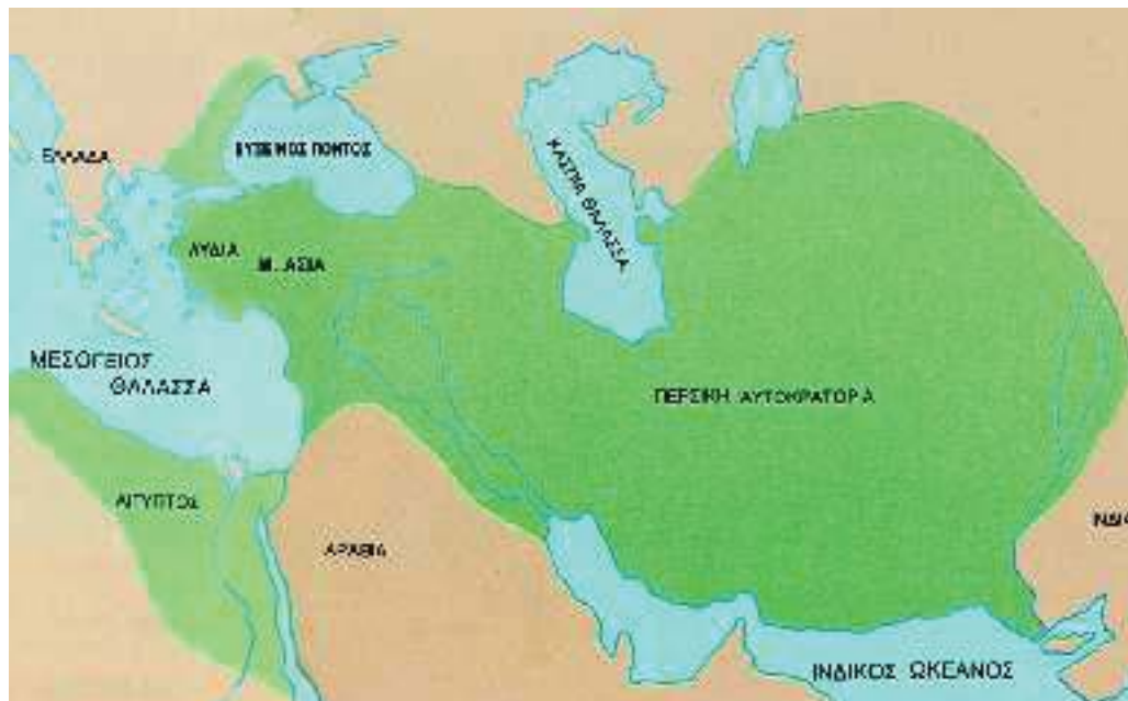
2. Η Περσική αυτοκρατορία