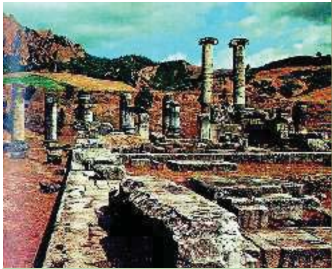
5. Ερείπια από τις Σάρδεις