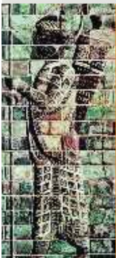
1. Στρατιώτης - τοξότης της φρουράς του Δαρείου

Οι ελληνικές πόλεις της Μ. Ασίας δεν είχαν κάνει δικό τους κράτος. Διαιρεμένες όπως ήταν έχασαν την ελευθερία τους και, προπάντων, δεν μπορούσαν να εμπορευτούν ελεύθερα με άλλες πόλεις του Εύξεινου πόντου. Όταν μάλιστα οι Πέρσες έκαναν εκστρατεία στη Θράκη, ανά-