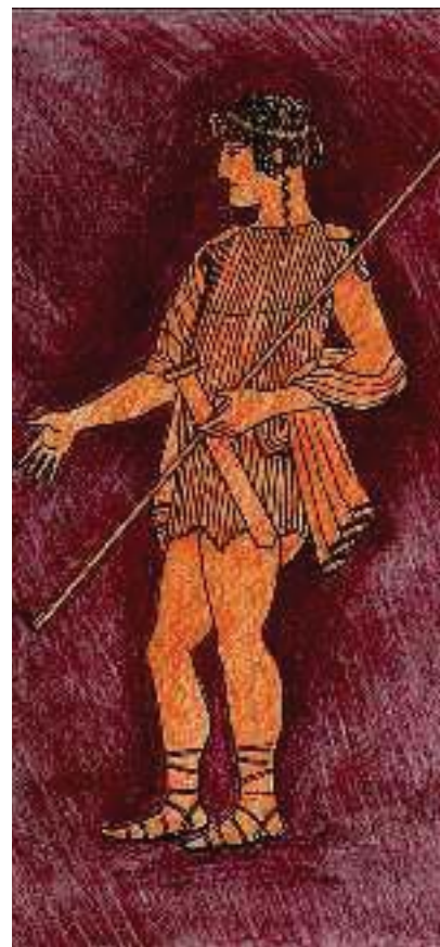
2. Ο Θησέας