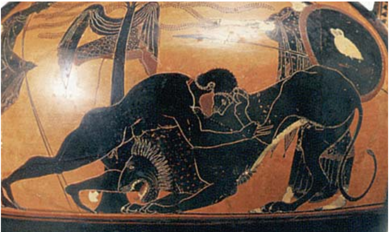
1. Ο Ηρακλής παλεύει με το λιοντάρι της Νεμέας. Από αρχαίο ελληνικό αγγείο.

Ο Ηρακλής, πηγαίνοντας στη Νεμέα , πέρασε από το ιερό άλσος της πόλης, έκοψε μια αγριελιά κι απ' τον κορμό της έφτιαξε ένα βαρύ ρόπαλο . Μετά πήγε και περίμενε κοντά στη φωλιά του λιονταριού κι, όταν αυτό φάνηκε, το χτύπησε πρώτα με τα βέλη του. Τα βέλη έπεσαν στη γη χωρίς να το τραυματίσουν και το λιοντάρι επιτέθηκε στον Ηρακλή. Εκείνος το χτύπησε με το ρόπαλο. Το λιοντάρι πόνεσε και κρύφτηκε στη φωλιά του. Ο Ηρακλής τότε μάζεψε μεγάλες πέτρες, έκλεισε τη μια είσοδο και μπήκε από την άλλη. Το ζώο βρυχήθηκε και σειστήκε όλο το βουνό. Όρμησε πάνω στον ήρωα και πάλευαν μια ώρα. Τέλος ο Ηρακλής τύλιξε τα χέρια του γύρω από το λαιμό του και το έπνιξε. Μετά πήρε το δέρμα του, τη λεοντή , το φόρεσε και γύρισε στις Μυκήνες. Όταν τον είδε ο Ευρυσθέας τρόμαξε πολύ και διέταξε να του φτιάξουν ένα χάλκινο πιθάρι, για να κρύβεται, όταν θα κινδύνευε.