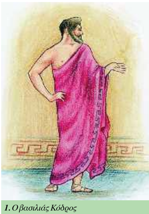
1. Ο βασιλιάς Κόδρος

ΤΟ ΠΟΛΙΤΕΥΜΑ: ο τρόπος με τον οποίο κυβερνιέται μια χώρα (λέμε: ολιγαρχικό, δημοκρατικό πολίτευμα).