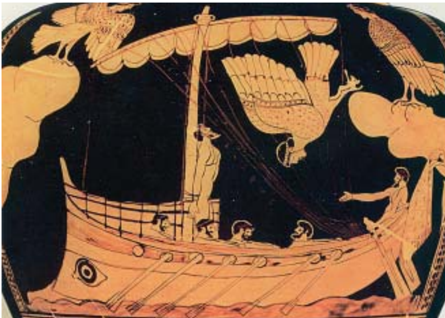
3. Ο Οδυσσέας στις Σειρήνες. Από αρχαίο ελληνικό αγγείο.