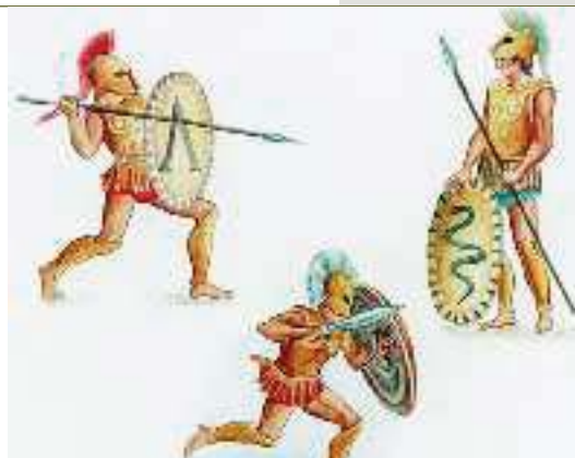
3. Σπαρτιάτες πολεμιστές