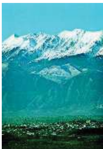
2. Αποψη της σύγχρονης Σπάρτης με τον Ταΰγετο

Ο πρώτος βασιλιάς στη Λακωνία ήταν ένας ντόπιος, ο Λέλεγας. Από αυτόν οι παλιοί κατοικοι έγονταν Λέλεγες. Ο εγγονός αυτού, ο Ευρώτας, έφτιαξε ένα κανάλι στον κάμπο και έριξε τα νερά της περιοχής στη θάλασσα. Έτσι σχηματίστηκε το ποτάμι που πήρε το όνομά του. Ο Ευρώτας δεν είχε δικά του αγόρια και άφησε τη βασιλεία στο Λακεδαίμονα, τον άντρα της κόρης του, που ήταν γιος του Δία. Αυτός έδωσε το όνομά του στη χώρα και στους κατοίκους της. Μετά έχτισε μία πόλη που της έδωσε το όνομα της γυναίκας του, της Σπάρτης. Η πόλη αυτή μέχρι σήμερα ονομάζεται έτσι.