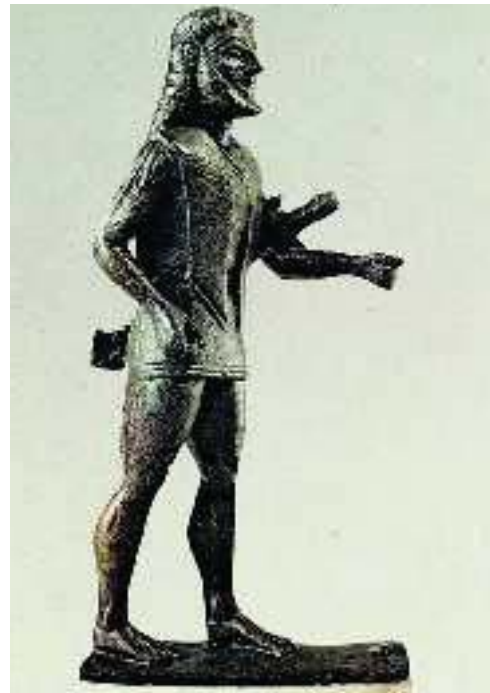
4. Χάλκινο άγαλμα Σπαρτιάτη πολεμιστή με ξίφος (Ολυμπία, Αρχαιολογικό Μουσείο)