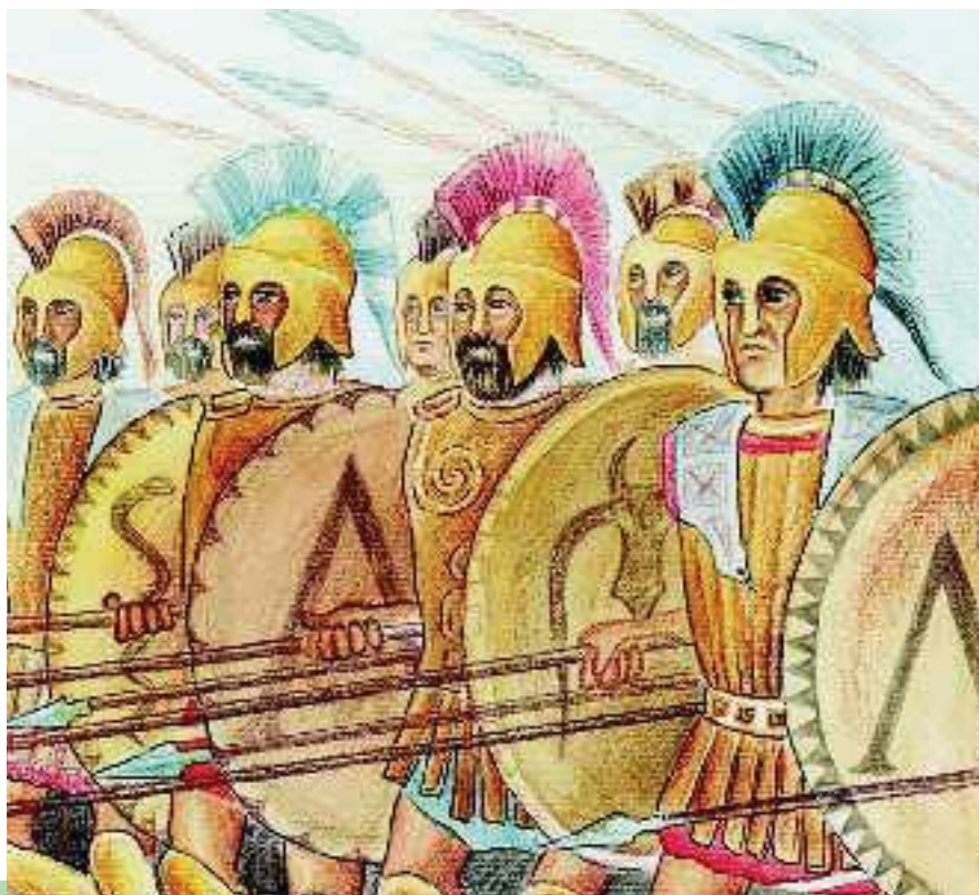
1. Σπαρτιατική φάλαγγα

στρατιώτες, παρατεταγμένοι ο ένας δίπλα στον άλλο, έτοιμοι για μάχη