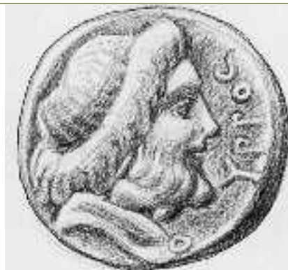
3. Αναπαράσταση από σπαρτιατικό νόμισμα. Το πρόσωπο που απεικονίζεται είναι ο Λυκούργος (Αθήνα, Εθνικό Αρχαιολογικό Μουσείο).