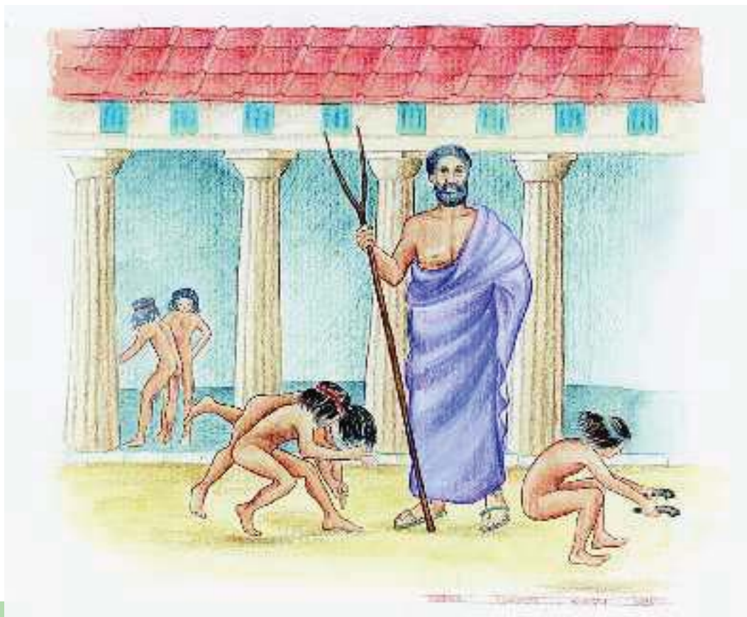
2. Οι νέοι στη Σπάρτη γυμνάζονταν καθημερινά

Στις γιορτές των Σπαρτιατών υπήρχαν τρεις χοροί ανάλογοι με τις τρεις ηλικίες του ανθρώπου. Πρώτα άρχιζε ο χορός των γερόντων που τραγουδούσε: «Ήμαστε κι εμείς κάποτε γενναίοι». Στη συνέχεια τους απαντούσε ο χορός των αντρών που έλεγε: «Εμείς είμαστε τώρα γενναία παλικάρια, κι αν έχεις τη δύναμη τόλμησε». Τρίτος τραγουδούσε ο παιδικός χορός που έλεγε: «Εμείς θα γίνουμε μια μέρα πολύ καλύτεροι από εσάς».