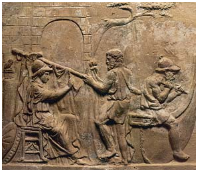
1. Η Αθηνά και ο Άργος (δεξιά) κατασκευάζουν την Αργώ. Αρχαίο ελληνικό ανάγλυφο.

Ταξιδεύοντας για την Κολχίδα, οι Αργοναύτες σταμάτησαν στη Θράκη. Εκεί συνάντησαν το μάγνη Φινέα, που τους φανέρωσε ότι θα συναντούσαν στο ταξίδι τους τις Συμπληγάδες πέτρες και τους συμβούλεψε, πριν περάσουν ανάμεσά τους, ν' αφήσουν πρώτα ένα περιστέρι να περάσει. Αν περνούσε το περιστέρι, θα περνούσε και η Αργώ.