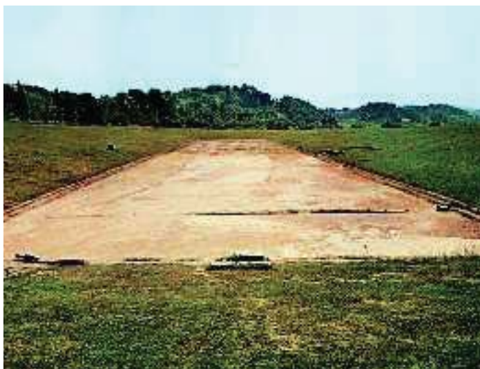
4. Το στάδιο της αρχαίας Ολυμπίας