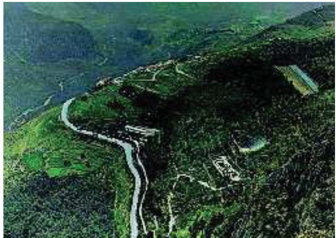
5. Ο αρχαιολογικός χώρος των Δελφών