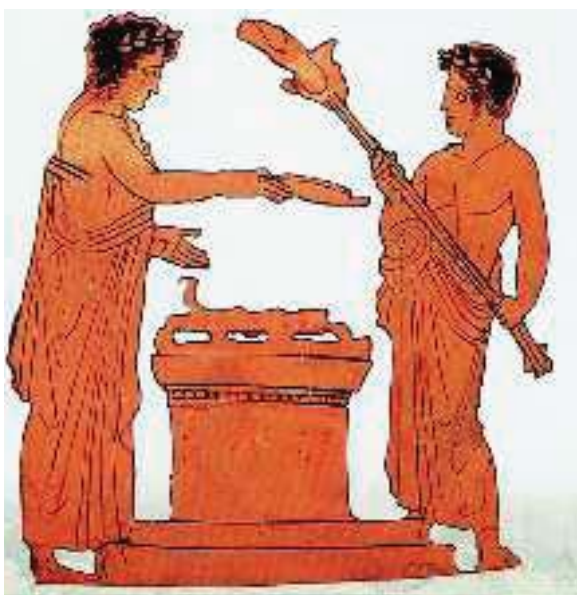
3. Στον ιερό βωμό του μαντείου των Δελφών ήταν πάντα αναμμένη η φωτιά.

Οι Έλληνες, όπως όλοι οι άνθρωποι, ήθελαν να προβλέψουν τι θα γίνει στο μέλλον. Για να βρούνε απαντήσεις στα προβλήματά τους πήγαιναν στα μαντεία. Το πιο γνωστό ήταν το μαντείο των Δελφών που ήταν αφιερωμένο στο θεό Απόλλωνα. Οι χρησμοί, όπως λέγονταν οι απαντήσεις που έδινε η Πυθία, δεν είχαν πάντοτε ξεκάθαρο νόημα.