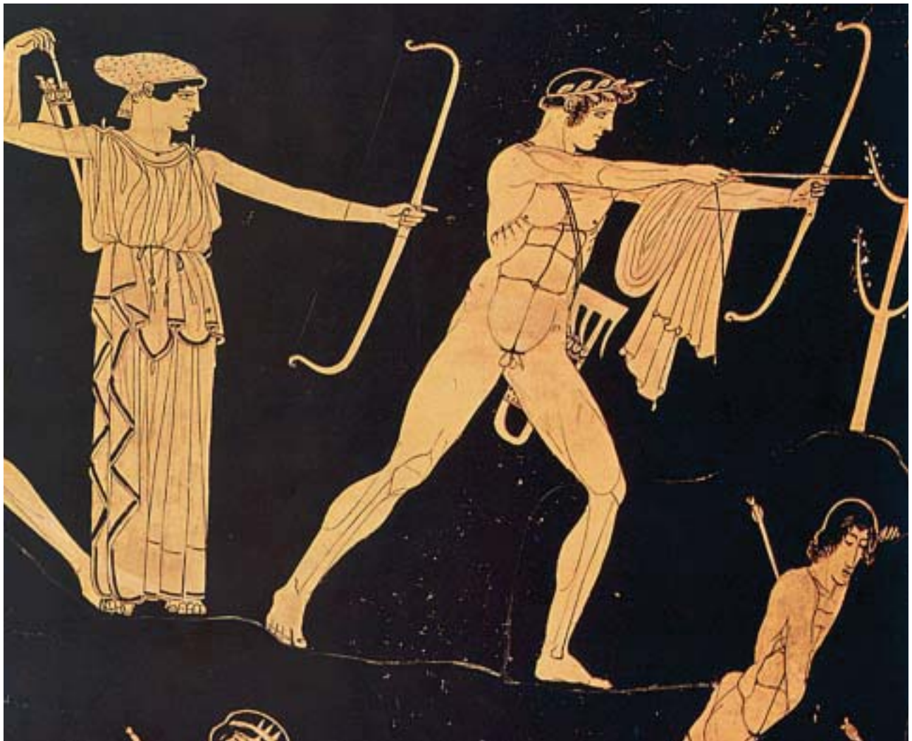
1. Ο Απόλλωνας ρίχνει τα βέλη του. Από αρχαίο ελληνικό αγγείο.

Ο Χρύσης τότε παρακάλεσε τον Απόλλωνα να τιμωρήσει σκληρά τους Αχαιούς. Ο Απόλλωνας τον άκουσε από τον Όλυμπο κι αμέσως πήρε το τόξο του και πήγε στο στρατόπεδο των Αχαιών. Κάθισε παράμερα και αόρατος χτυπούσε με τα βέλη του τα ζώα και τους ανθρώπους. Έπεσε τότε αρρώστια φοβερή ανάμεσά τους και πέθαιναν οι Αχαιοί, ο ένας μετά τον άλλο.