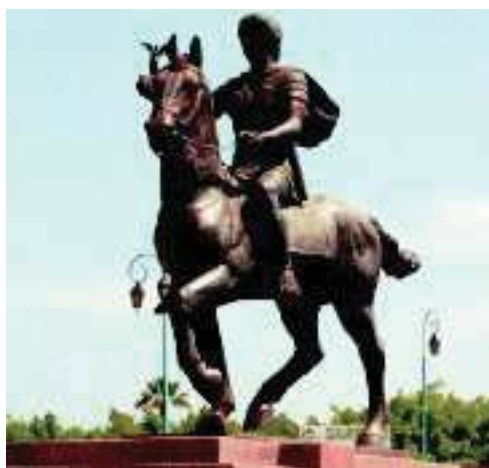
2. Άγαλμα του Μ. Αλεξάνδρου που βρίσκεται στην Αλεξάνδρεια της Αιγύπτου.

Ν. Πολίτης, Παραδόσεις του ελληνικού λαού, τόμος Α', σελ. 387, (διασκευή)