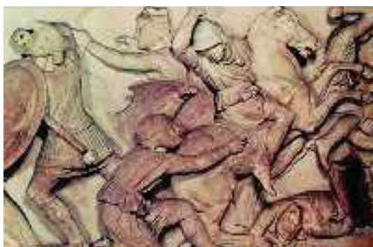
3. Τμήμα από σαρκοφάγο του Μ. Αλεξάνδρου (Μουσείο Κωνσταντινούπολης)

Όταν ο Μ. Αλέξανδρος έχασε κάθε ελπίδα να σωθεί, έβγαλε το δαχτυλίδι του και το έδωσε στον Περδίκκα. Οι φίλοι του τότε τον ρώτησαν σε ποιον αφήνει τη βασιλεία. Αυτός απάντησε: «Στον καλύτερο». Στη συνέχεια πρόσθεσε αυτές τις τελευταίες λέξεις: «Προβλέπω πως οι αγώνες που θα γίνουν προς τιμήν μου, μόλις πεθάνω, θα είναι μια μεγάλη μάχη των φίλων μου». Λόγια που σύντομα βγήκαν αληθινά. Μετά ξέσπασαν μεγάλοι αγώνες για τη βασιλεία.