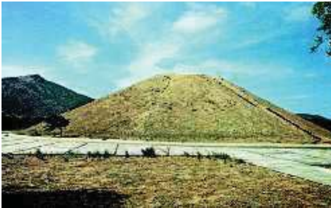
4. Ο τύμβος των Αθηναίων στο Μαραθώνα

Οι Σπαρτιάτες έστειλαν δυο χιλιάδες στρατιώτες στην Αθήνα μετά την πανσέληνο. Αυτοί βιάστηκαν τόσο πολύ να φτάσουν, ώστε έκαναν τη διαδρομή Αθήνα-Σπάρτη μέσα σε δύο μέρες. Έφτασαν όμως μετά τη μάχη και ζήτησαν να δουν τους Πέρσες. Εκείνοι τους πήγαν τότε στο Μαραθώνα και τους είδαν. Θαύμασαν τους Αθηναίους, τους έδωσαν συγχαρητήρια για τη λαμπρή νίκη τους και έφυγαν για τη Σπάρτη.