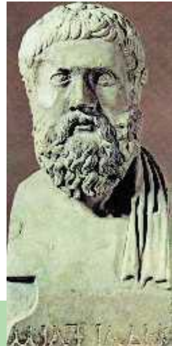
3. Μαρμάρινη προτομή του Μιλτιάδη (Ραβέννα, Αρχαιολογικό Μουσείο)