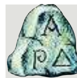
Άθως: η περιοχή της Χαλκιδικής όπου σήμερα βρίσκεται το Άγιο Όρος.

Έπρεπε λοιπόν να τρέξουν για να γλιτώσουν από τα βέλη. Όταν δόθηκε η διαταγή για επίθεση, όρμησαν προς τους Πέρσες, οι οποίοι στην αρχή τους πέρασαν για τρελούς. Η σύγκρουση έγινε σώμα με σώμα και σ' αυτό οι Αθηναίοι ήταν καλύτεροι. Τα δύο άκρα της ελληνικής παράταξης κατάφεραν να νικήσουν γρήγορα και άρχισαν να κυκλώνουν το περσικό κέντρο. Οι Πέρσες υποχώρησαν, έτρεξαν προς τα πλοία και βιάστηκαν να φύγουν. Οι Αθηναίοι πέτυχαν λαμπρή νίκη. Ένας στρατιώτης τρέχοντας μετέφερε τη χαρούμενη είδηση στην Αθήνα.