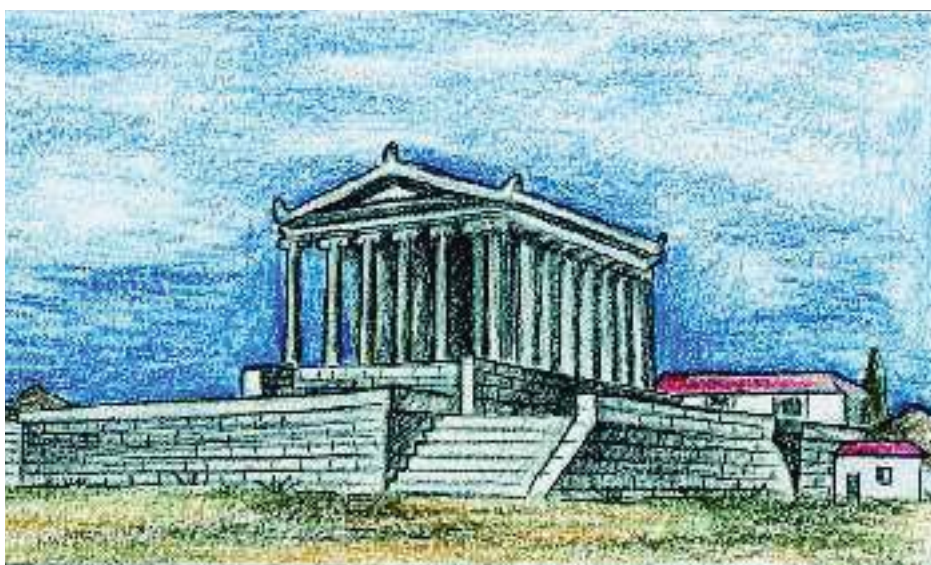
3. Αναπαράσταση του ναού της Αθηνάς που βρισκόταν στην αρχαία Μίλητο.

Ας αφήσουμε τους αποίκους να μοιράσουν μεταξύ τους τη γη και τα σπίτια. Στη μοιρασιά όμως πρέπει να σκεφτούν ότι αυτός που του τυχαίνει το χωράφι, να θεωρεί ότι το χωράφι του ανήκει σ' ολόκληρη την πόλη, γιατί είναι η πατρίδα του και πρέπει να την περιποιείται πιο πολύ απ' ό,τι μια μητέρα τα παιδιά της. Η πατρίδα είναι θεά, βασίλισσα των ανθρώπων. Έτσι πρέπει να σκέφτονται οι άποικοι και για τους θεούς.