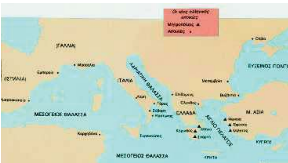
1. Χάρτης των αποικιών

η ακρόπολη: η οχυρωμένη τοποθεσία σ' ένα ψηλό σημείο της πόλης