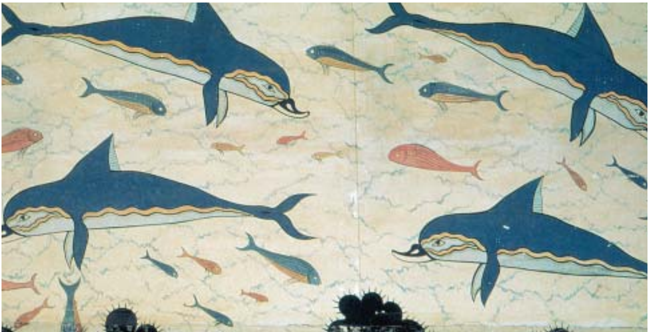
6. Η τοιχογραφία των δελφινιών από το δωμάτιο της βασίλισσας (αναπαράσταση).