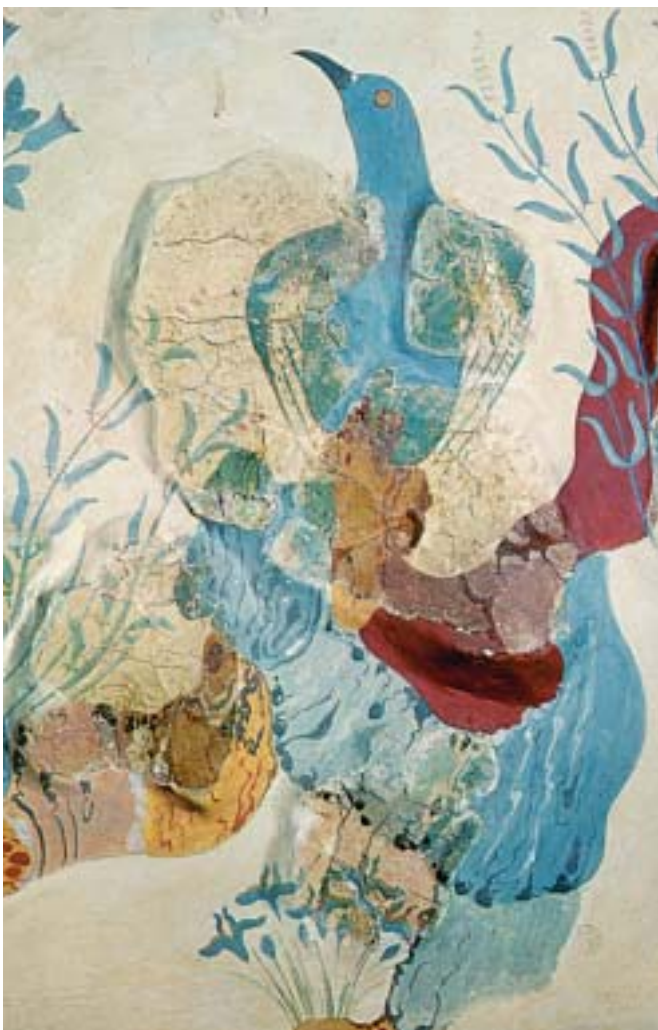
7. Το γαλάζιο πουλί.