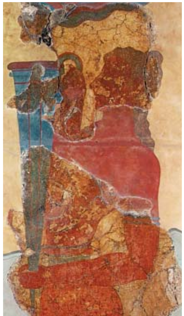
8. Μινωίτης που κρατάει ρυτό (=είδος αγγείου).