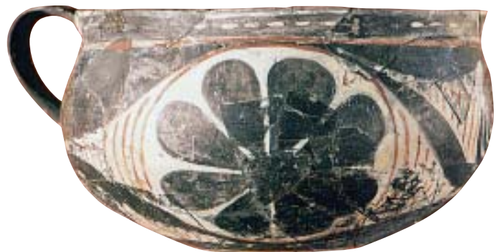
1. Πήλινα αγγεία διακοσμημένα με θέματα από τη φύση: το ένα με λουλούδια και το άλλο με παράσταση χταποδιού.