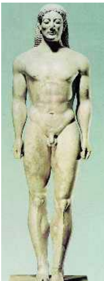
1. Ο κούρος της Αναβύσσου (Αθήνα, Εθνικό Αρχαιολογικό Μουσείο)

τα ιδιαίτερα χαρακτηριστικά που παρουσιάζει ένα έργο, όπως π.χ. ένας ναός.