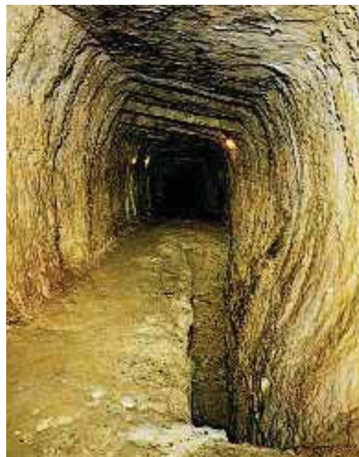
5. Ένα τμήμα της σήραγγας που ανοίχθηκε στο λόφο.