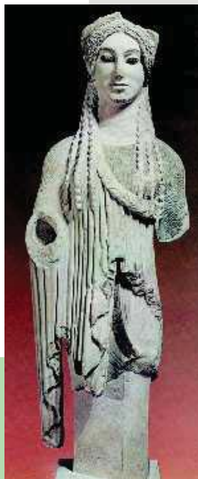
2. Η κόρη της Ακρόπολης (Αθήνα, Μουσείο Ακρόπολης)