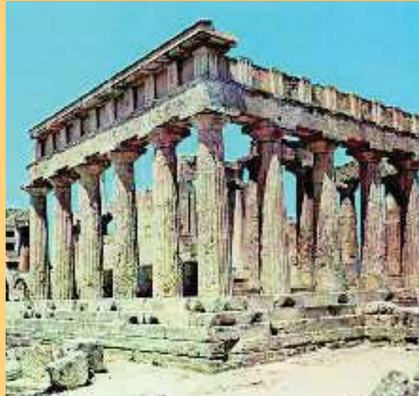
4. Τα ερείπια του ναού της Αφαίας Αθηνάς στην Αίγινα. Ο ναός είναι δωρικού ρυθμού.