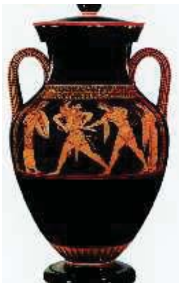
6. Ερυθρόμορφος αμφορέας με τον Ηρακλή να μαλώνει με τον Απόλλωνα για τον τρίποδα των Δελφών (Μουσείο Βερολίνου).

Τζον Μπόρντμαν, Αθηναϊκά ερυθρόμορφα αγγεία, (διασκευή)