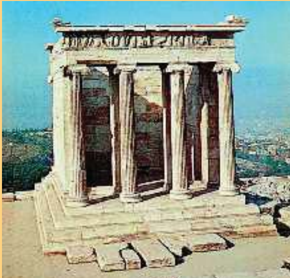
3. Ναός της Απτέρου Νίκης. Ο ναός είναι ιωνικού ρυθμού.

τισαν ζωγραφίζοντας πάνω στα αγγεία σκηνές από τη μυθολογία και την ιστορία. Οι μορφές άλλοτε ζωγραφίζονταν με μαύρο χρώμα (μελανόμορφος ρυθμός) και άλλοτε με κόκκινο (ερυθρόμορφος ρυθμός).