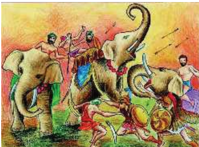
4. Πολεμική σκηνή από την εκστρατεία στην Ινδία

Αρριανός, Αλεξάνδρου Ανάβαση Ε , 28 - 29, 1 (διασκευή)