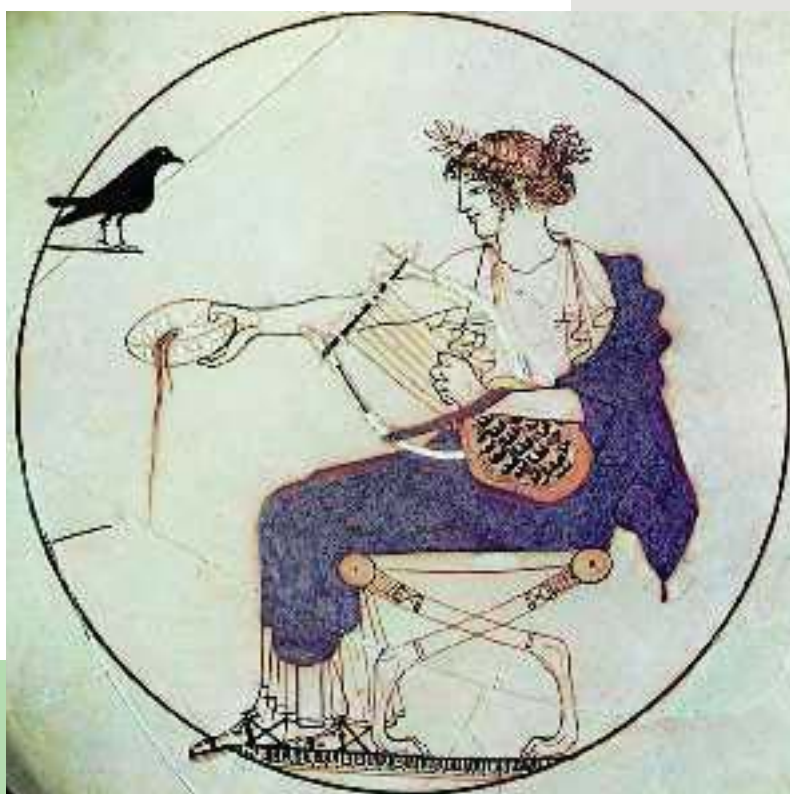
1. Ο θεός Απόλλωνας κρατώντας στο αριστερό του χέρι τη λύρα (Δελφοί, Αρχαιολογικό Μουσείο)

οι τελετές: οι εκδηλώσεις στις οποίες έπαιρναν μέρος πολλοί άνθρωποι.