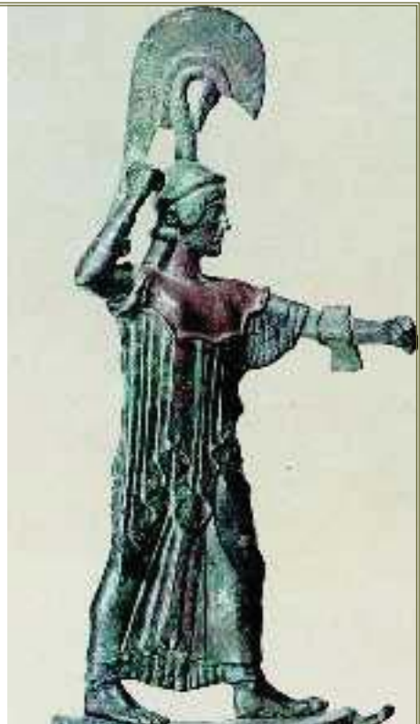
2. Χάλκινο άγαλμα της θεάς Αθηνάς. Η θεά προβάλλει το αριστερό χέρι με την ασπίδα και με το δεξί υψώνει το δόρυ (Αθήνα, Αρχαιολογικό Μουσείο).

Ερμής: αγγελιαφόρος των θεών και οδηγός των ψυχών των νεκρών στον Κάτω Κόσμο.