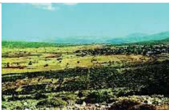
4. Σημερινή άποψη από την πεδιάδα των Πλαταιών

Ηρόδοτος, Ιστορία, Θ', 44 - 45 (διασκευή)