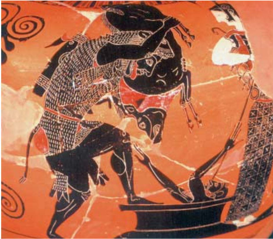
2. Ο Ηρακλής φέρνει στον Ευρυσθέα τον κάπρο του Ερύμανθου. Από αρχαίο ελληνικό αγγείο.