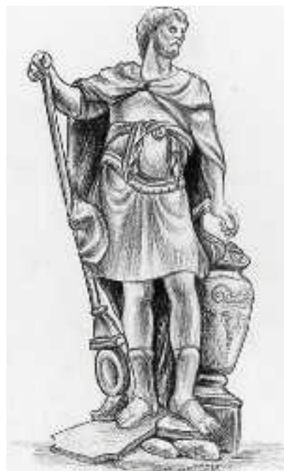
3. Ο Αννίβας, ο θουλικός αρχηγός των Καρχηδονίων

Βαγγέλης Μιλλεούνης, Ιστορικά Ανέκδοτα, σελ. 109 - 110 (διασκευή)