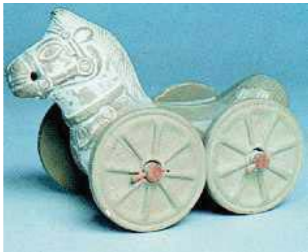
4. Πήλινο αλογάκι (Αρχαιολογικό Μουσείο Αθηνών)

Αφού διαβάσετε το κείμενο, να απαριθμήσετε τα παιχνίδια που έπαιζαν τα παιδιά και μετά να πείτε ποια από αυτά παίζετε κι εσείς σήμερα.