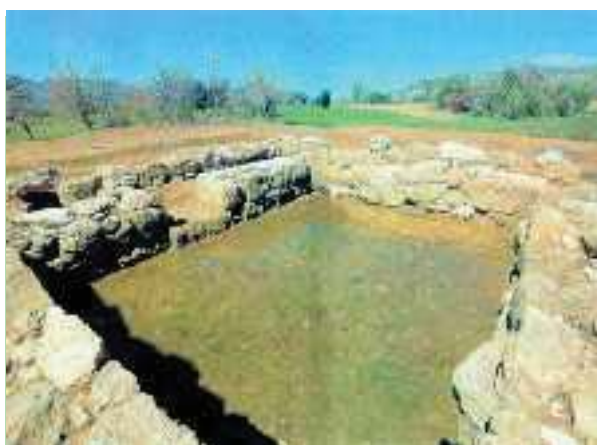
4. Ο τάφος του Επαμεινώνδα

Διόδωρος Σικελιώτης, Ιστορική Βιβλιοθήκη, ΙΕ', 87, (διασκευή)