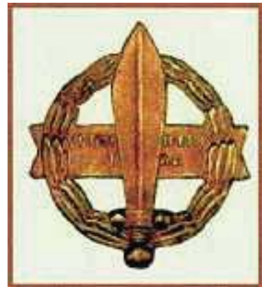
5. Το έμβλημα του ιερού λόχου το 1942

Εγκυκλοπαίδεια Κόσμος, τόμος 12, σ. 445- 446 (διασκευή)