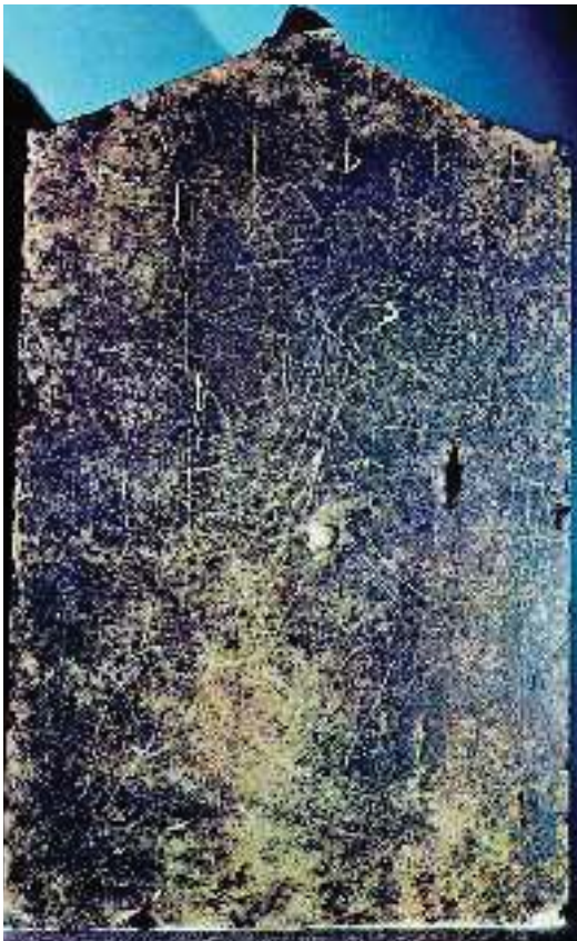
2. Επιτύμβια στήλη με παράσταση Βοιωτού πολεμιστή (Θήβα, Αρχαιολογικό Μουσείο)

βάση τους όρους της συμφωνίας αυτής, οι συμμαχίες έπρεπε να διαλυθούν. Στο συνέδριο ο Θηβαίος Επαμεινώνδας ζήτησε να υπογράψει ως αρχηγός όλων των Βοιωτών. Αυτό δεν το δέχτηκαν οι άλλοι αντιπρόσωποι και η συνάντηση έληξε χωρίς αποτέλεσμα.