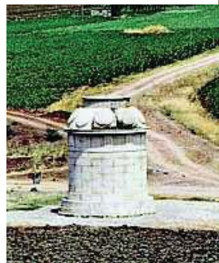
3. Το τρόπαιο που έστησαν οι Θηβαίοι στα Λεύκτρα σε ανάμνηση της νίκης τους.