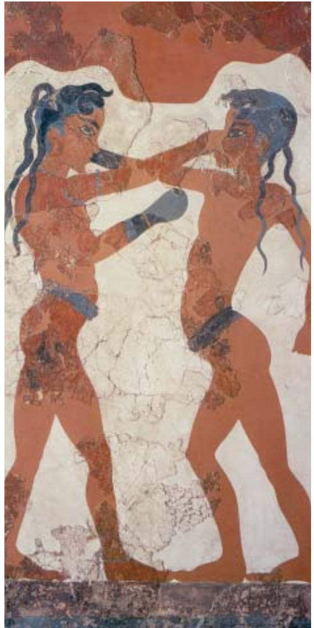
2. Ο ψαράς και οι πυγμάχοι, δυο τοιχογραφίες από τη Θήρα.