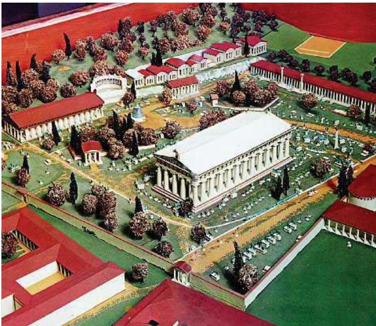
7. Αναπαράσταση των μνημείων του Ιερού της Ολυμπίας

Μετά την πραγματοποίηση της επίσκεψης και, αφού επιστρέψουμε στο σχολείο, η κάθε ομάδα θα επεξεργαστεί και θα καταγράψει σε τελική μορφή όλα τα αποτελέσματα της έρευνας που έκανε στο πεδίο που είχε αναλάβει. Στη συνέχεια θα γίνει παρουσίαση μέσα στην τάξη και θα ακολουθήσει ανάλογη συζήτηση. Μεγάλη σημασία θα πρέπει να δώσουμε και στο φωτογραφικό υλικό που έχουμε συγκεντρώσει από το χώρο που επισκεφτήκαμε. Επίσης θα πρέπει να τονίσουμε το ρόλο που παίζει ο συγκεκριμένος αρχαιολογικός χώρος στη ανάπτυξη του τουρισμού και της οικονομίας της περιοχής. Ιδιαίτερα η αρχαία Ολυμπία που σχετίζεται άμεσα με τους σύγχρονους Ολυμπιακούς αγώνες είναι σίγουρα μια περιοχή με συμβολική σημασία και η ιστορία της είναι γνωστή σε όλο τον κόσμο.