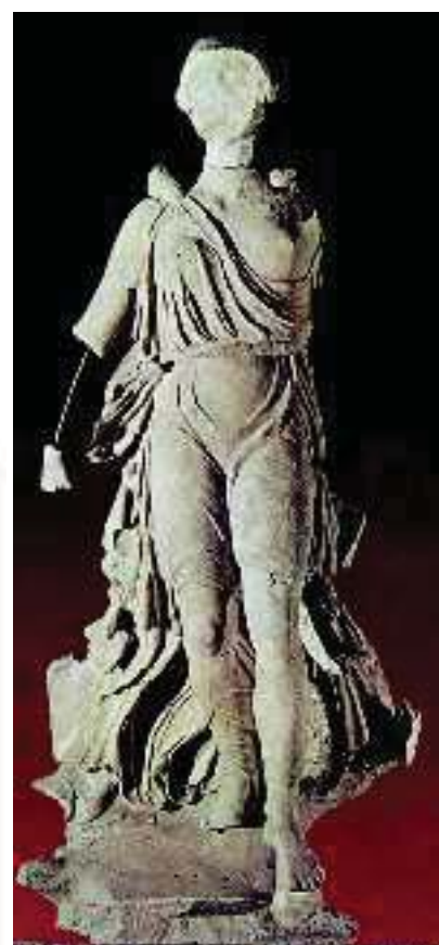
6. Η Νίκη του Παιωνίου (Μουσείο Αρχαίας Ολυμπίας)