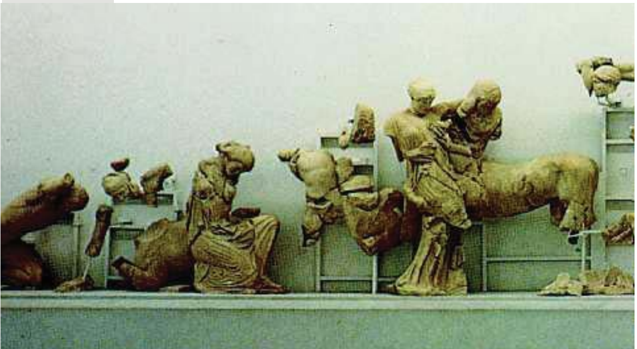
4. Κενταυρομαχία, από το ναό του Διός