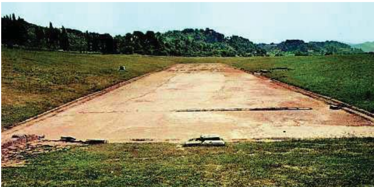
3. Το στάδιο της Ολυμπίας

Γ' Ομάδα 19 Αφού περάσουμε την Κρυπτή Στοά, που ήταν όλη σκεπασμένη με χώμα, φτάνουμε στο στάδιο της Ολυμπίας που ήταν το μεγαλύτερο στάδιο της Ελλάδας. Το