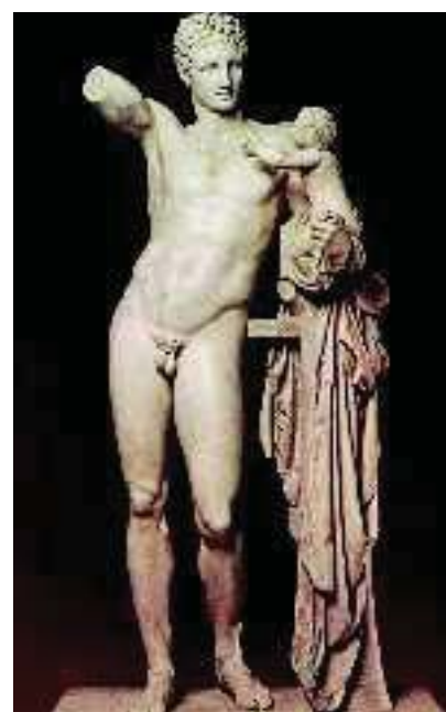
5. Ο Ερμής του Πραξιτέλους (Μουσείο Αρχαίας Ολυμπίας)

➔ Θα κάνουμε υποθέσεις σχετικές με το φρούτο που κρατούσε στο άλλο χέρι ο Ερμής.