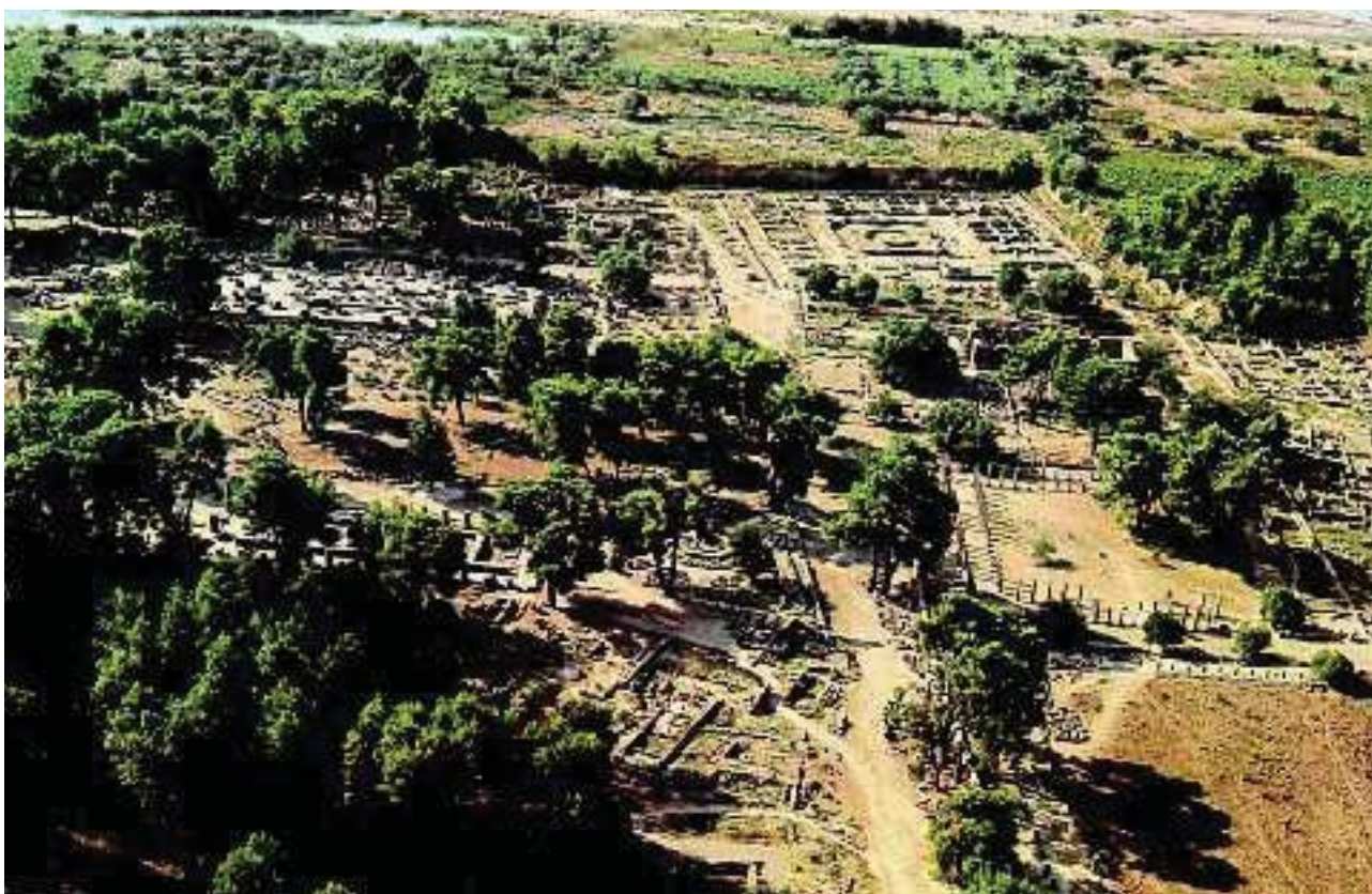
2. Το ιερό της Ολυμπίας

Α' Ομάδα 1,2 Το Γυμνάσιο ήταν ο χώρος, όπου οι αθλητές γυμνάζονταν και προπονούσαν (ονομάστηκε Γυμνάσιο γιατί οι αθλητές ήταν γυμνοί). Η Παλαίστρα είχε πλούσια κιονοστοιχία και γύρω γύρω διάδρομο που οδηγούσε στα λουτρά, τα αποδυτήρια και άλλους χώρους ξεκούρασης των αθλητών .