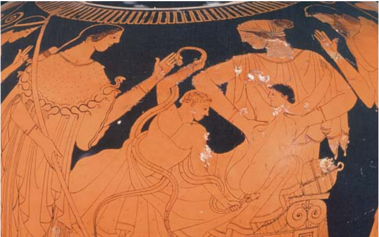
2. Ο Ηρακλής πνίγει τα φίδια. Τα πρόσωπα στην εικόνα είναι: η Αλκμήνη, η Αθηνά, ο Ηρακλής, ο Ιφικλής, η παραμίνα τους και ο Αμφιτρούωνας. Από αρχαίο ελληνικό αγγείο.