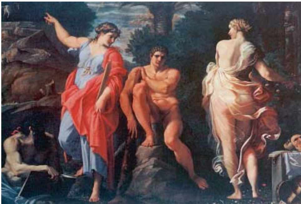
8. Ο Ηρακλής στο σταυροδρόμι της Αρετής και της Κακίας. Έργο ζωγραφικής της νεότερης εποχής.

Ξενοφώντας, Απομνημονεύματα , 2, 1, 21 (διασκευή)