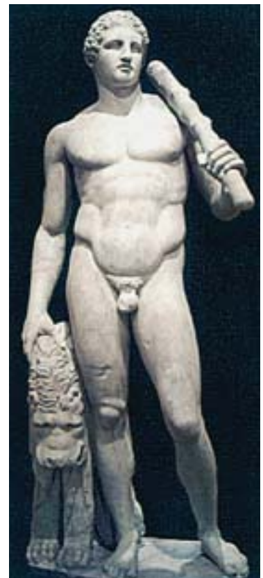
6. Ο Ηρακλής

Διόδωρος Σικελιώτης, Ιστορική Βιβλιοθήκη , 4, 10, 2, μτφ. Απ. Παπανδρέου