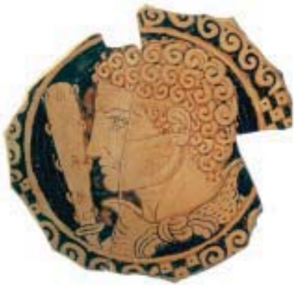
3. Ο Ηρακλής σε νεαρή ηλικία