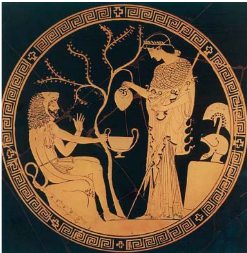
Ο Ηρακλής και η θεά Αθηνά, που πάντα του συμπαραστεκόταν.

Ο Ηρακλής είναι ο μεγαλύτερος ήρωας της ελληνικής μυθολογίας. Γιος του Δία και μιας θνητής βασιλοπούλας, της Αλκμήνης, ήταν ο δυνατότερος απ' όλους τους ανθρώπους. Εξολόθρευσε άγρια θηρία και τέρατα, έδιωξε τυράννους και σκότωσε κακούς βασιλιάδες. Ήταν πάντα δίκαιος, καλόκαρδος και πρόθυμα βοηθούσε τους ανθρώπους. Ήταν ατρόμητος κι ανίκητος και τα κατορθώματά του έμειναν για πάντα αξέχαστα.