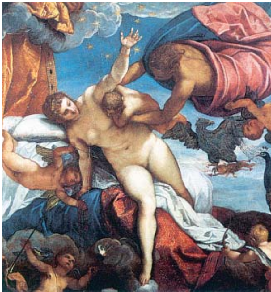
1. Η δημιουργία του Γαλαξία.

Όταν μεγάλωσε ο Ηρακλής, παντρεύτηκε την κόρη του βασιλιά της Θήβας, τη Μεγάρρα κι έγινε ο ίδιος βασιλιάς. Κυβέρνησε μερικά χρόνια τη Θήβα και ζούσε ευτυχισμένος.