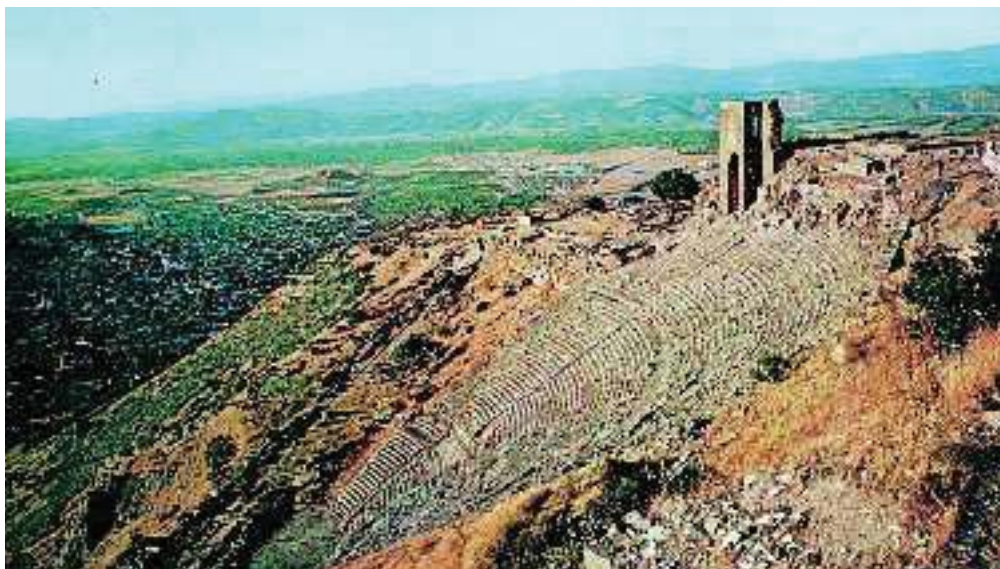
4. Το αρχαίο θέατρο της Περγάμου

Η Πέργαμος ήταν χτισμένη σ' ένα οχυρωμένο ύψωμα και είχε στολιστεί με πολλά όμορφα μνημεία. Η αγορά ήταν υπαίθρια. Υπήρχαν γυμναστήρια, ναοί θεών, όπως της Δήμητρας και της Ήρας, θέατρο με 10.000 θέσεις. Το λαμπρότερο όμως μνημείο της πόλης ήταν ο περίφημος «Βωμός του Σωτήρα Δία», ένα από τα εφτά θαύματα του αρχαίου κόσμου. Τα γλυπτά του ήταν μοναδικά έργα τέχνης. Περίφημη ήταν και η βιβλιοθήκη της πόλης. Στα χρόνια της ακμής της ανταγωνιζόταν και αυτή τη βιβλιοθήκη της Αλεξάνδρειας. Οι κάτοικοι της Περγάμου χρησιμοποιούσαν για γραφή κατεργασμένο λεπτό δέρμα ζώου, την περγαμνή. Έπαιρναν το δέρμα του ζώου, το καθάριζαν από τις τρίχες και μετά το έκαναν λείο. Οι περγαμνές χρησιμοποιήθηκαν το 2ο αι. π.Χ., επειδή υπήρχε έλλειψη παπύρου (είδος φυτικού χαρτιού), που εισαγόταν από την Αίγυπτο. Αργότερα η περγαμνή χρησιμοποιήθηκε πολύ, ειδικά στα επίσημα έγγραφα.