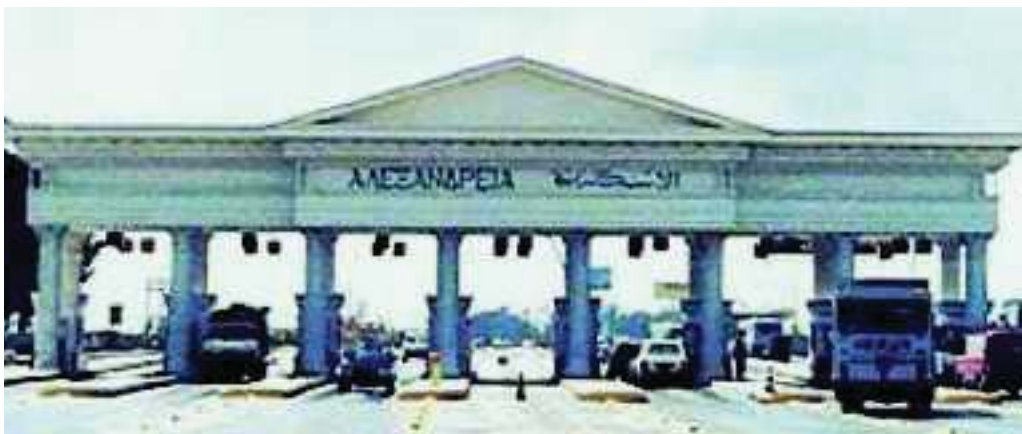
3. Η είσοδος της σύγχρονης πόλης της Αλεξάνδρειας

Ο Αλέξανδρος αποφάσισε να χτίσει στην Αίγυπτο μια μεγάλη πόλη. Όρισε την έκταση της πόλης και χάραξε τους δρόμους της με πολλή τέχνη και την ονόμασε με τ' όνομά του, Αλεξάνδρεια. Χτισμένη σε κατάλληλη θέση κοντά στο λιμάνι, δέχεται το δροσερό αέρα που έρχεται από τη θάλασσα και δροσίζει την ατμόσφαιρά της. Έτσι εξασφάλισε στους κατοίκους της μαζί με το καλό κλίμα και καλή υγεία. Έχει μία λεωφόρο θαυμαστή για το μέγεθος και την ομορφιά της, που χωρίζει την πόλη στα δύο. Είναι στολισμένη σε όλο το μήκος της με πλούσια σπίτια και ναούς. Ο Μ. Αλέξανδρος διέταξε να χτίσουν μεγάλα και πολυτελή ανάκτορα. Η πόλη στα κατοπινά χρόνια αναπτύχθηκε τόσο πολύ, ώστε από πολλούς να λογαριάζεται σαν η πρώτη πόλη της οικουμένης.