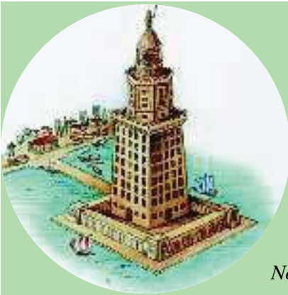
2. Αναπαράσταση του φάρου της Αλεξάνδρειας, που ήταν ένα από τα επτά θαύματα του κόσμου (Αλεξάνδρεια, Ναυτικό Μουσείο).

Το κράτος της Αιγύπτου ίδρυσε ο στρατηγός του Μ.Αλεξάνδρου, Πτολεμαίος. Πρωτεύουσα έγινε η Αλεξάνδρεια, η οποία απέκτησε μεγάλη φήμη για τα λαμπρά της οικοδομήματα και τους σοφούς ανθρώπους που εγκαταστάθηκαν εκεί.