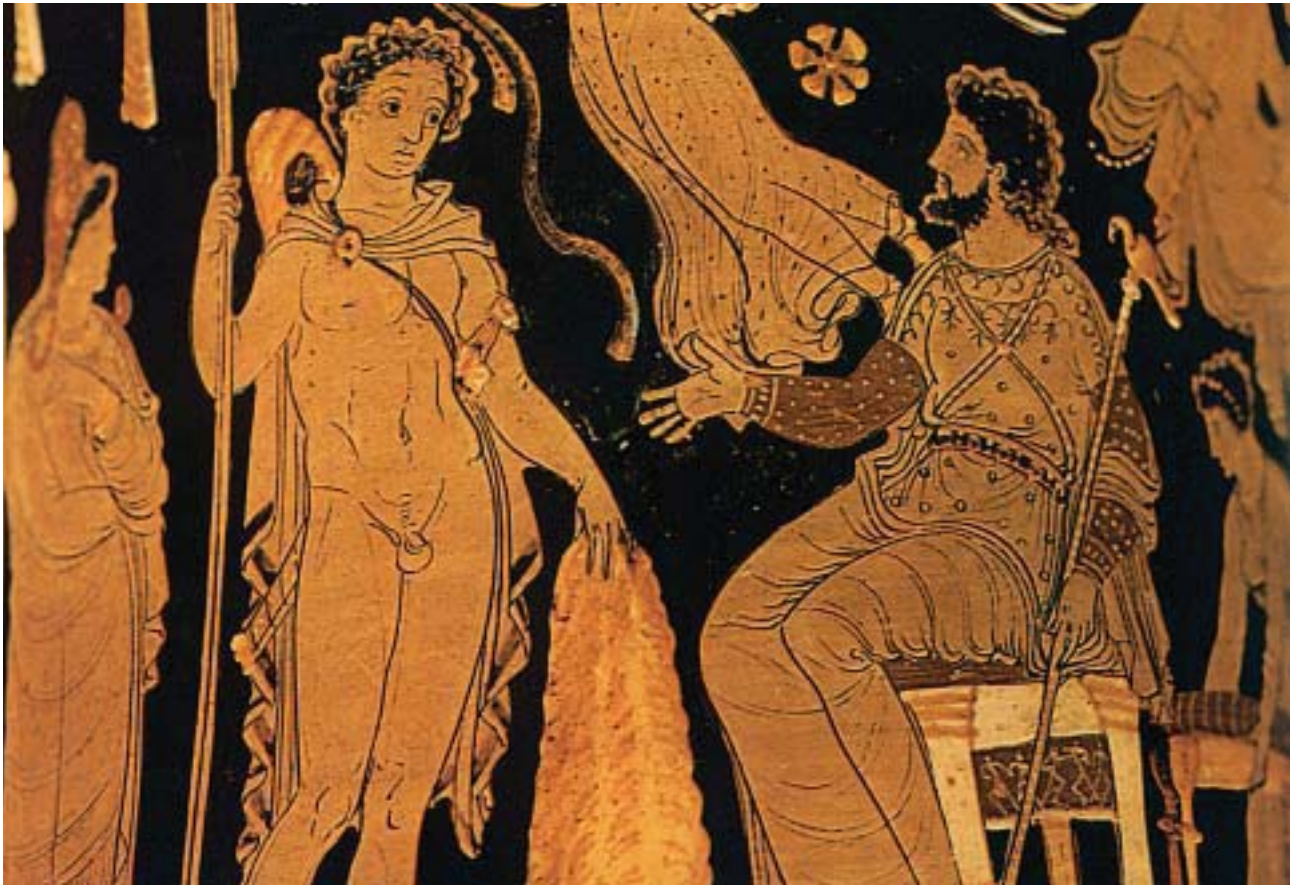
2. Ο Ιάσοντας παραδίδει το χρυσόμαλλο δέρας στον Πελία. Από αρχαίο ελληνικό αγγείο.