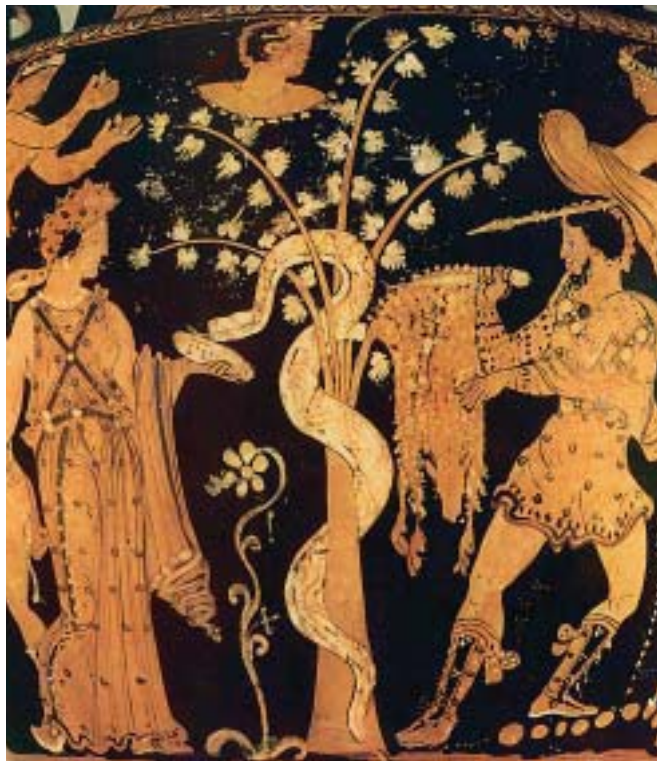
1. Ενώ η Μήδεια αποκοιμίζει το δράκο, ο Ιάσοντας αρπάζει το χρυσόμαλλο δέρας.

Ο Ιάσοντας πήγαινε συχνά και καθόταν κοντά στην Αργώ. Κάποτε όμως, κι ενώ είχε γίνει πια γέρος, έπεσε ένα ξύλο από το κατάρτι της Αργώς και τον σκότωσε.