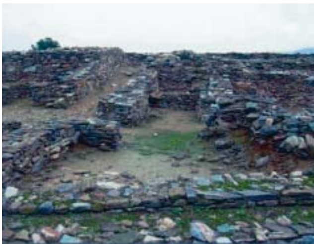
4. Τα ερείπια του Διμηνίου.