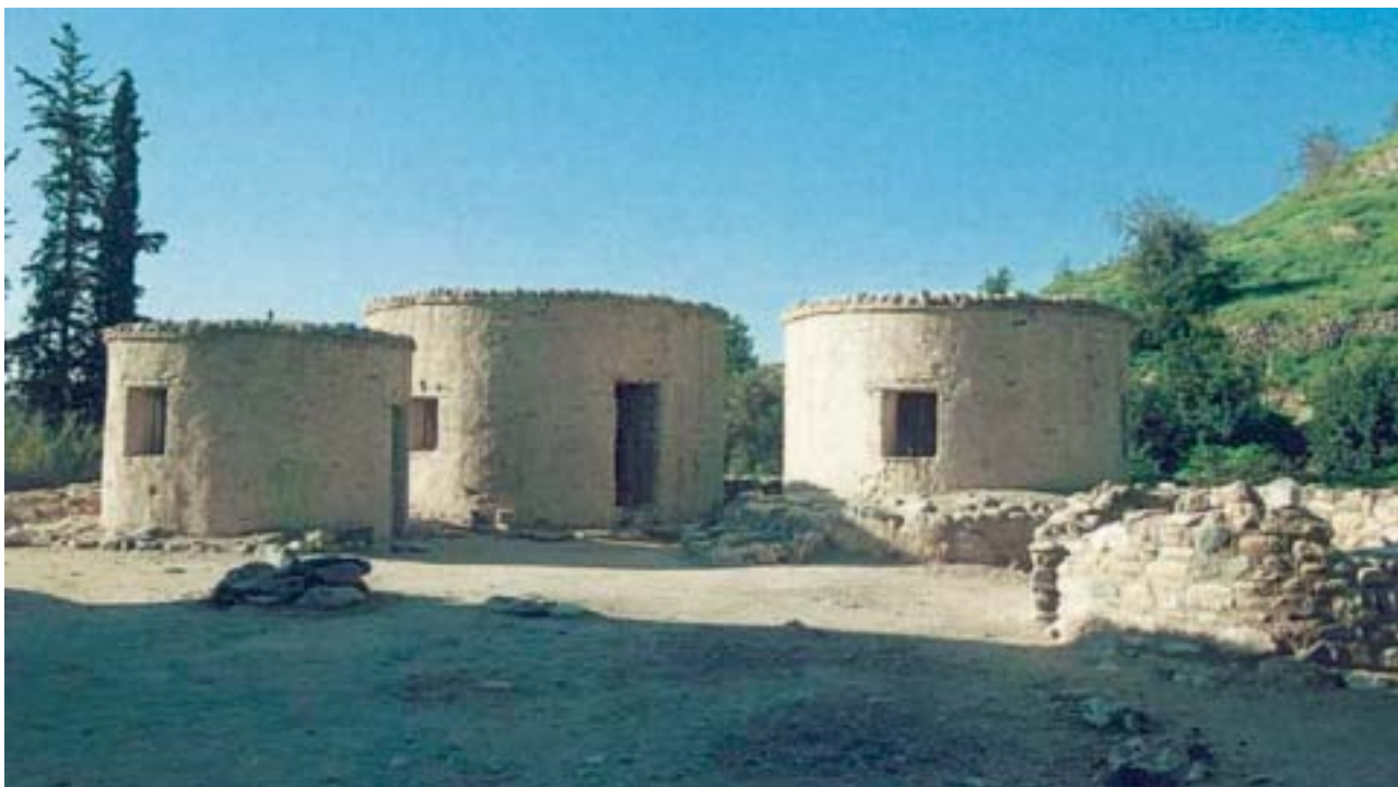
6. Σπίτια από τον οικισμό της Χοιροκοιτίας στην Κύπρο.