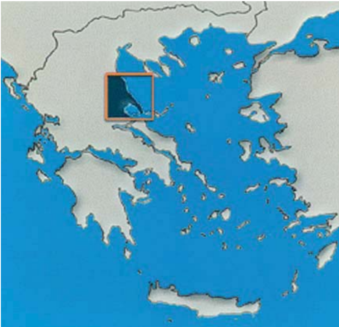
1. Στο πλαίσιο είναι η περιοχή της σημερινής Μαγνησίας, όπου αναπτύχθηκαν οι πιο σημαντικοί νεολιθικοί οικισμοί στην Ελλάδα: το Σέσκλο και το Διμήνι.

Και οι δυο οικισμοί είχαν τείχη γύρω γύρω, για να προφυλάσσονται οι κάτοικοι. Οι κάτοικοι των οικισμών αυτών δημιούργησαν ένα σημαντικό πολιτισμό που ανήκε στη νεολιθική εποχή .