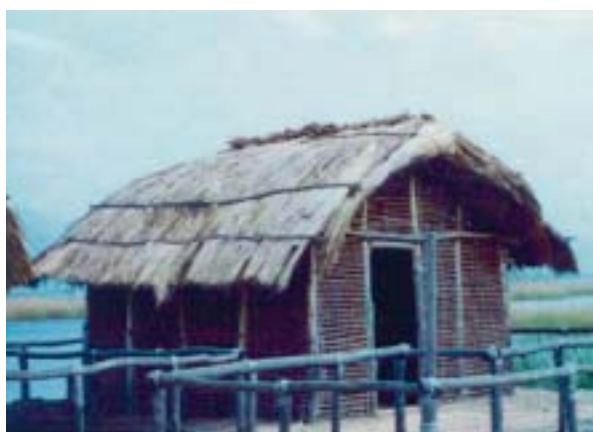
7. Αναπαράσταση σπιτιού από το νεολιθικό οικισμό του Δισπηλιού στη λίμνη της Καστοριάς.