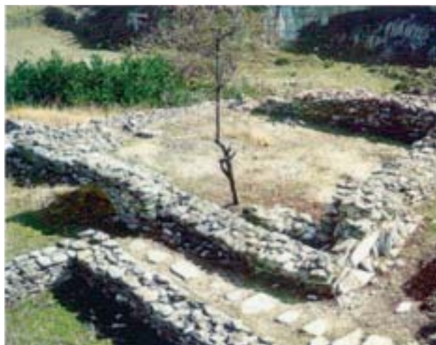
5. Τα ερείπια του Σέσκλου.